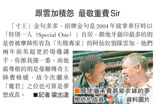
摩佬繼承費爵爺衣鉢的夢想終於成真。資料圖片