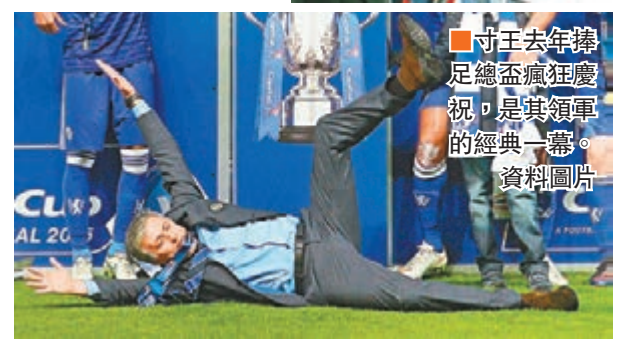
寸王去年捧足總盃瘋狂慶祝，是其領軍的經典一舉。資料圖片