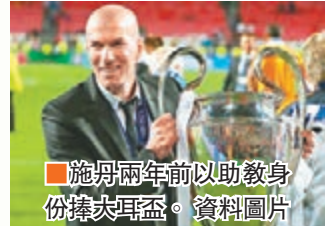
施丹兩年前以助教身份捧大耳盃。資料圖片

2010年歐聯曾作客米蘭攻入國際米蘭3球而成名的加里夫巴利今次再踏聖西路這福地，他說：「歷史已過去，我在此地有美好回憶，有望今次能以最佳方式完結本球季。」