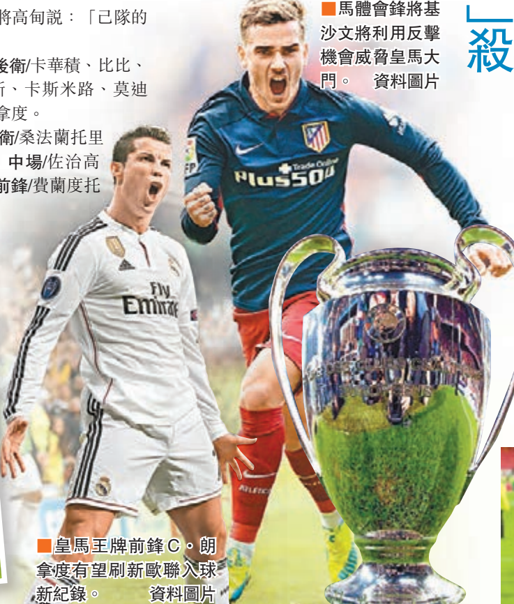
皇馬王牌前鋒C·朗拿度有望刷新歐聯入球新紀錄。資料圖片