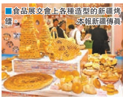
食品展交會上各種造型的新疆烤餅。本報新疆傳真

自2014年3月開行首列「西行國際班列」以來，至今由新疆始發的「西行國際班列」已形成本點始發、多地運行、多點到達的格局，基本實現對中亞各鐵路站點的全覆蓋，輻射整個中亞地區。開行目的地包括格魯吉亞、土耳其、俄羅斯、伊朗、波蘭等歐亞國家。