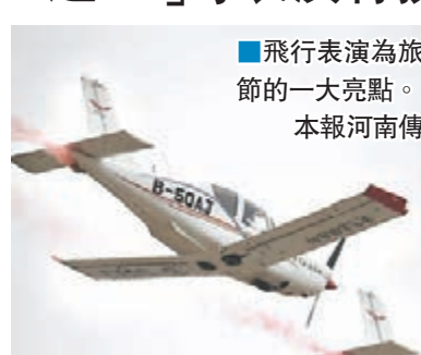
飛行表演為旅遊節的一大亮點。

香港文匯報訊（記者劉蕊 安陽報道）2016安陽愛飛客飛行大會暨第八屆安陽航空運動文化旅遊節昨日在河南安陽正式開幕，活動為期三天。其中飛行表演既有常規經典飛行表演項目，也有國際知名特技飛行表演，運12、直升機、無人機、動力傘等多種飛行器，將續寫飛行特技傳奇。