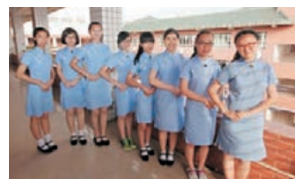
港式「旗袍」校服受廣州學生青睞。本報廣州傳真

據學校梁老師介紹，這套傳統樣式校服，靈感來自香港真光中學的校服。據悉，真光書院自1872年在廣州創辦以來，在海內外都有分支，這種普及的民國校服樣式，早已為香港學生所穿着。長堤真光中學正逐步換裝，也是延續百年真光的傳統。如今，長堤真光中學初一學生已全面