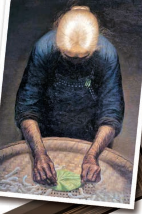
羅中立的畫作《春蠶》36年後在重慶展出，風景重現觀眾眼前。本報重慶傳真

羅中立曾講述《春蠶》的創作由來。1980年，他在創作完成《父親》之後，決定延續這一題材的創作，於是很快有《春蠶》、《金秋》、《祈》、《蒼天》等一系列作品。《春蠶》其實是《父親》的姊妹篇，所以這件作品也可以叫作《母親》。