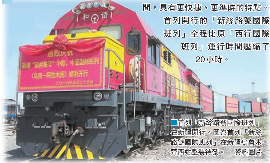
首列「新絲路號國際班列」在新疆烏魯木齊火車站整裝待發。資料圖片

香港文匯報訊（記者應江洪 新疆報道）由43組、57個集裝箱組成的首列「新絲路號國際班列」前日由新疆烏魯木齊火車站出發，將在運行約39.5小時後，抵達哈薩克斯坦共和國阿拉木圖市。該趟班列是烏魯木齊鐵路局對已開行的「西行國際班列」優化命名為「新絲路號」後首次開行的國際班列。與原「西行國際班列」相比，「新絲路號國際班列」在定點（固定始發站和終到站）、定線（固定運行線）、定車次、定時（固定到發時間）、定價（一口價）的基礎上，又壓縮了運行時間，具有更快捷、更準時的特點。