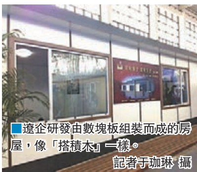
遼寧研發由數塊板組裝而成的房屋，像「搭積木」一樣。

香港文匯報訊（記者于琳 瀋陽報道）第五屆中國國際現代建築產業博覽會日前在遼寧瀋陽開幕，現場兩棟40平方米和114平方米的住宅建築引起關注——形似農村自建房的住宅結構中沒有一磚一瓦，由數塊板子像「搭積木」般組裝而成。這套當日首發的複合板式模塊化住宅產品，由瀋陽遠大新農村產業集團遠大易居研發設計，聚焦新農村建設中農民住房改善問題，特別採全工業化方式，讓農民經過簡單培訓即可自助完成住宅組裝。