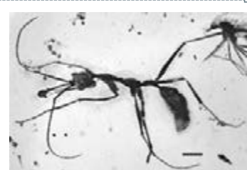
原始蟻類「獨角蟻」首次被發現。網上圖片

江蘇中科院南京地質古生物研究所研究人員與法國、美國學者組成的科研團隊在一項最新研究中，對距今1億年左右的2,000餘枚琥珀蟻標本進行調查，首次發現一類生活在白堊紀中期、長有大牙且頭上有「角」的原始捕食性蟻類「獨角蟻」。這一發現修正了此前對早期蟻類形態的認識，研究團隊還通過形態分析證實，最原始的蟻類並非群居，而是一類獨居的捕食性昆蟲。