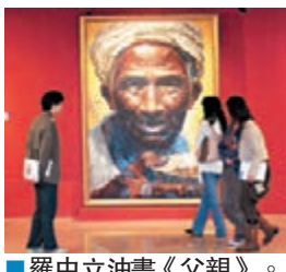
羅中立油畫《父親》。資料圖片