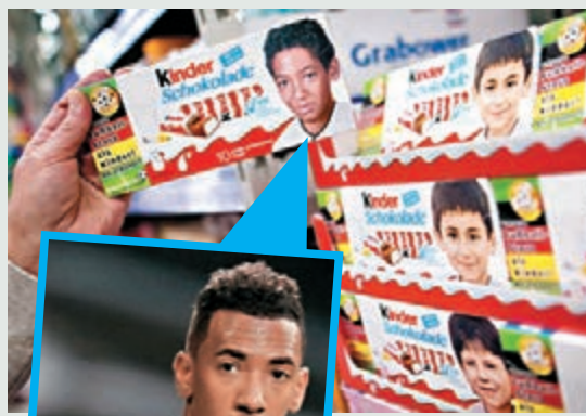
Kinder為迎接歐洲國家盃，包裝換成德國國腳童年照。

為迎接下月歐洲國家盃，朱古力品牌Kinder最近在德國推出新包裝，將原本的小童照片，換成德國國家隊球員童年照，包括黑人後衛謝路美保定。不過極右反移民組織「歐洲愛國者反西方伊斯蘭化」(PEGIDA)卻有眼不識泰山，批評公司起用中東和非洲小孩，結果不單惹來種族歧視指控，更慘被網民恥笑。