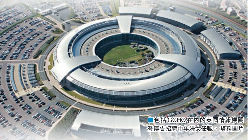
包括GCHQ在內的英國情報機關登廣告招聘中年婦女任職。資料圖片

一般人對間諜的印象，主要來自電影《007》系列的占士邦。不過英國情報機關周三宣佈，計劃聘請沒有大學學歷的中年婦女，對抗外國間諜及恐怖主義，而且還可以「彈性上班」，理由是她們的人生歷練有助工作。當局甚至在主婦網站Mumsnet刊登招聘廣告。