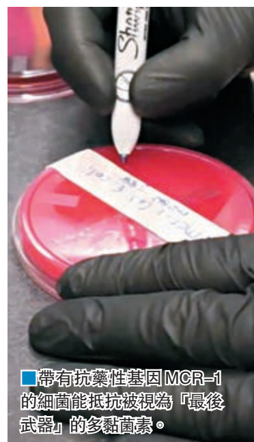
帶有抗藥性基因MCR-1的細菌能抵抗被視為「最後武器」的多黏菌素。

美國疾病控制及預防中心(CDC)主管弗里登前日表示，美國發現首宗對所有已知抗生素具抗藥性的超級細菌病例，包括能抵抗被視為「最後武器」的多黏菌素，且屬本土感染病例，擔心若廣泛傳播，將造成嚴重危險。弗里登形容它為「夢魘超級細菌」，令人類有「身處後抗生素時代的風險」。研究報告於美國微生物學會刊物《抗菌劑與治療》發佈。