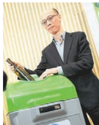
黃錦星稱擬仿外國每750毫升玻璃樽收0.75元。資料圖片