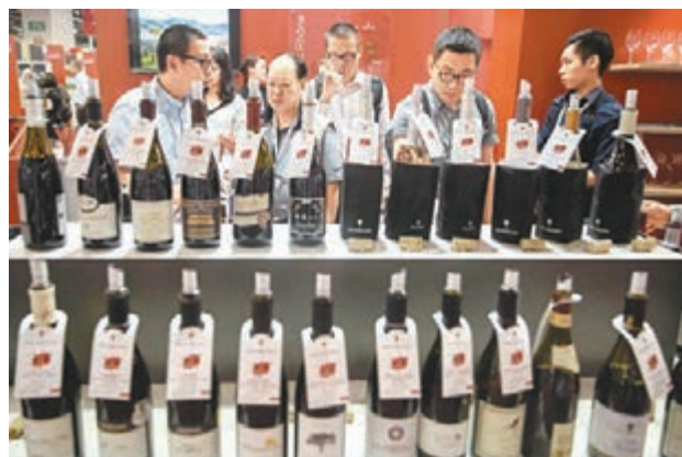
立法會昨日三讀通過實施玻璃飲料容器徵收費用的條例草案。圖爲早前會展舉行的葡萄酒展。

香港文匯報訊（記者 文森）繼膠袋徵費後，立法會昨日三讀通過實施玻璃飲料容器徵收費用的條例草案，規定玻璃樽裝飲品如酒類、水、奶、茶都要徵費，最快可在2018年推行，具體徵費水平待定。港府表示，會參考外國做法，每公升的飲品樽收1元、750毫升的酒樽收費0.75元。多名立法會議員批評政府立法配套不足，擔心徵費最終只會轉嫁消費者，希望當局推出誘因鼓勵回收及加強教育。