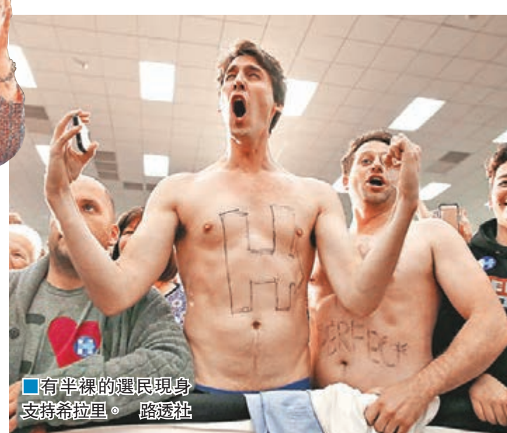
■有半裸的選民現身支持希拉里。