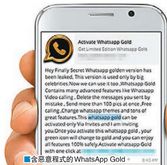
含惡意程式的 WhatsApp Gold。