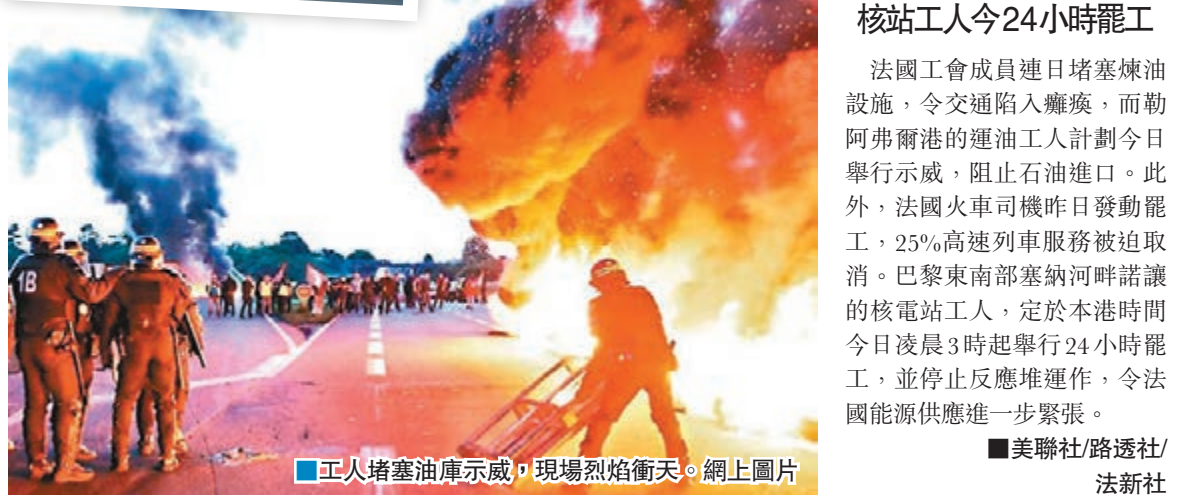
工人堵塞油庫示威，現場烈焰衝天。