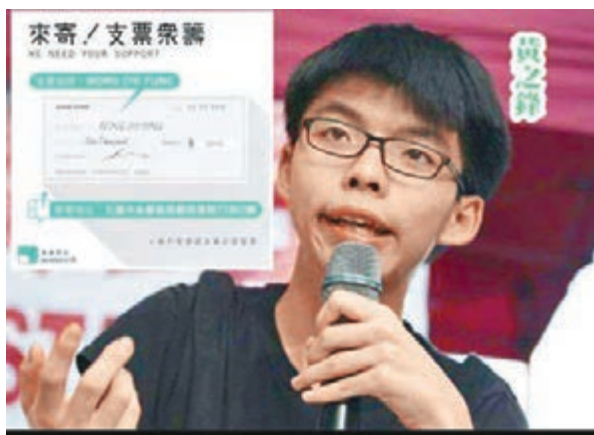
學民黨舊賬都仲未交代清楚，又叫人開劃線支票界佢。佢做戲同講大話就叻，佢信得過，豬乸味都識爬樹？