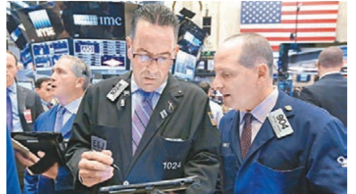
聯儲局加息預期升溫,資金流向顯示,過去6周股票型基金流出近500億美元,近周美股資金流出逾47億美元,規模最大。圖為美國證交所。

附表顯示,過去六周合計,股票型基金遭資金撤出496億美元。各類債券型基金中以投資等級債券型基金近周流入15億美元最多,連續第11周獲資金流入,高收益與新興市場債券型基金雖遭資金流出,但流出規模分別僅有1億與0.38億美元,新興市場債券型基金為13周來首次遭資金流出。