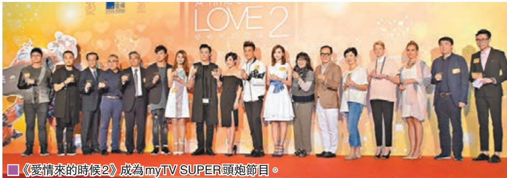
《愛情來的時候2》成為myTV SUPER頭炮節目。