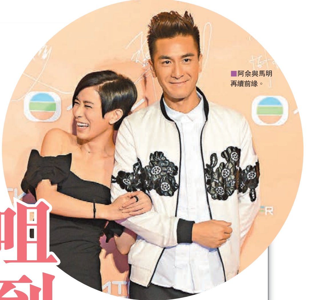
阿余與馬明再續前緣。