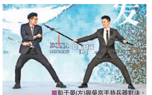
彭于晏(左)與吳京手持兵器對決。

大會又提供了一個可伸縮的全景自拍器予二人,讓他們跟全場自拍,自稱跟彭于晏是「好基友」的吳京亦拿這個可伸縮的自拍器開玩笑,他叫彭于晏幫他「把握」,彭也回了一句「可加長呀」,令到現場大笑。