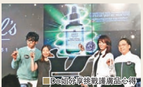
Do姐分享挑戰護膚品心得

其實，藜麥（Quinoa）是南美洲特產，從前罕為人知，直至近年才為世人認識。玻利維亞人用作主要糧食已超過3000年，藜麥熱潮風靡全球飲食界，獲捧為「超級食物」，是其中一種最健康的「有營」穀物，含豐富蛋白質、基本氨基酸和維他命。最新發現藜麥具有天然去角質成分，令其強大天然能力擴展到抗老護膚範疇——真正美容界突破。在體外測試中，顯示這成分能限制角質層黏結，維持角質層的整齊排列而不會刺激肌膚。於是，品牌為善用這玻利維亞天然資源，特別與玻利維亞供應商及基金合作，確保當地農民可持續生產藜麥。三年多期間，在天然煥活配方中添加藜麥成分，已促進250個玻利維亞農夫及其家庭的社會經濟發展。品牌研創這一款有效清理老化角質層且適用於敏感性膚質的產品，標誌品牌產品研發專家的科研成果。