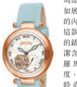
Folli Follie Heart4Heart Diaphanous

而國際生活時尚品牌Folli Follie亦呈獻以Heart4Heart的品牌經典圖案為設計主題的全新Heart4Heart Diaphanous腕錶系列，系列兼具優雅風格與現代設計，將現代元素融入經典款式，其標誌性的Heart4Heart圖案在錶盤上生動奪目，巧妙地揭示了腕錶的局部構造，猶如展現佩戴者的內心世界。這款自動腕錶的錶盤設計簡潔含蓄，配搭羅馬數字刻度，適合各種時尚造型搭配。