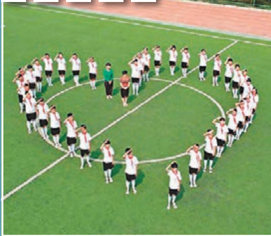
齊魯私立學校玩航拍，36名學生與兩名教師在操場併成各種圖案的圖片，如心形、圓形等，一起拍具有創意的畢業照。