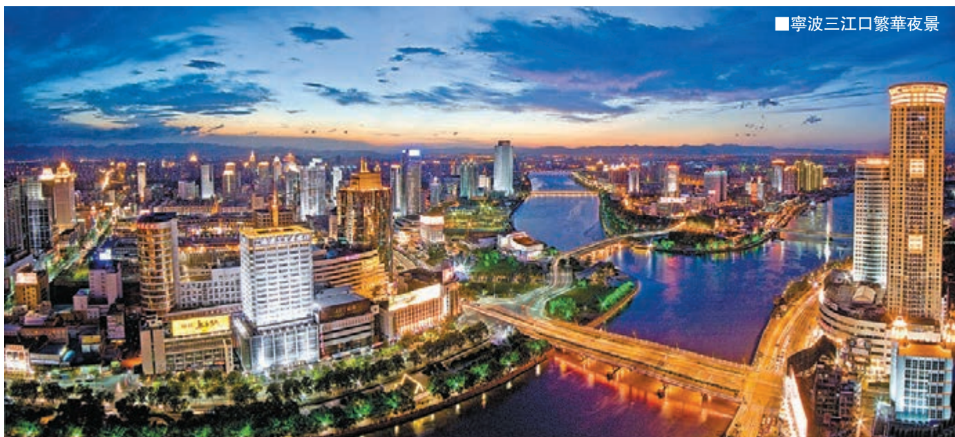
寧波三江口繁華夜景

今年浙洽會、消博會、中東歐博覽會將圍繞「一帶一路」和長江經濟帶國家戰略，以「深化合作、互利共贏」為主題，通過舉辦投資洽談、展覽交易、會議論壇、人文交流等系列活動，全面提升浙江國際交流合作和全省開放型經濟發展水平。