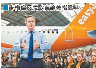
卡梅倫反脫歐言論被指靠嚇。

留歐的負面影響。支持脫歐的前倫敦市長約翰遜形容報告是「騙局」，部分保守黨資深後座議員表明，針對卡梅倫的不信任動議已「無可避免」，即使留歐陣營在公投中險勝，若卡梅倫仍決定留任至任期結束，他將要面臨不信任動議。