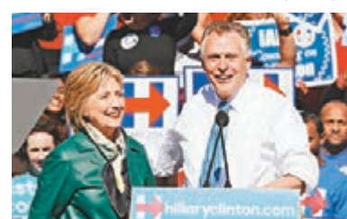
麥奧利夫(右)與希拉里關係密切。