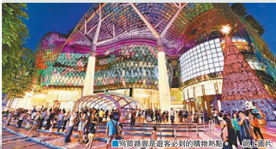
烏節路曾是遊客必到的購物熱點。