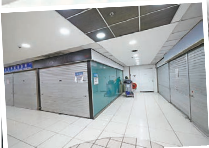
遠東廣場很多店舖東主都止蝕離場。