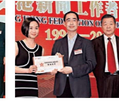
▲特等獎送出由香港航空提供的雙入澳新黃金海岸商務倉往返機票