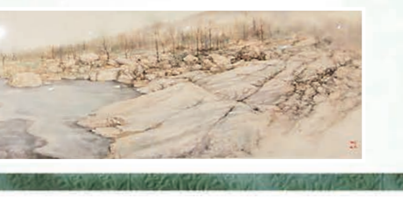
▲澳門中聯辦主任李剛作品

多倍價格拍出的，在眾人的歡聲笑語中為競拍環節帶來「開門紅」。在眾多拍品中，有兩幅墨寶特別珍貴，是著名國學大師饒宗頤先生捐贈的墨寶，其中一幅更是由香港新聞工作者聯合會執行主席捐出。饒宗頤先生的書法作品一字難求，一直是各界成功人士夢寐以求的珍品。而這兩幅墨寶《福》、《福澤滿門》寓意吉祥，底蘊深厚，更獨特的是，這兩幅作品作於饒老百歲華誕之時，意義非凡，甚為難得。這兩幅墨寶分別以68萬、200萬拍價，現場爆發出陣陣熱烈掌聲，嘉賓們爭相拍照，留下這珍貴難忘的一刻。