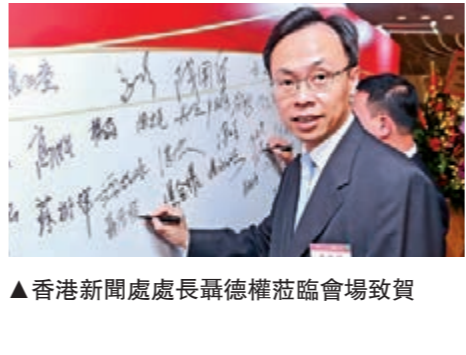
▲香港新聞處處長高德權蒞臨會場致賀