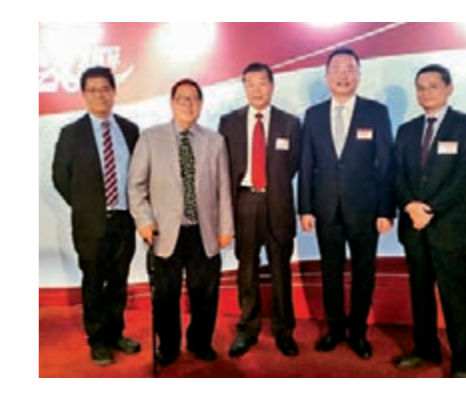
▲澳門新聞局長陳致平及媒體同行到場祝賀