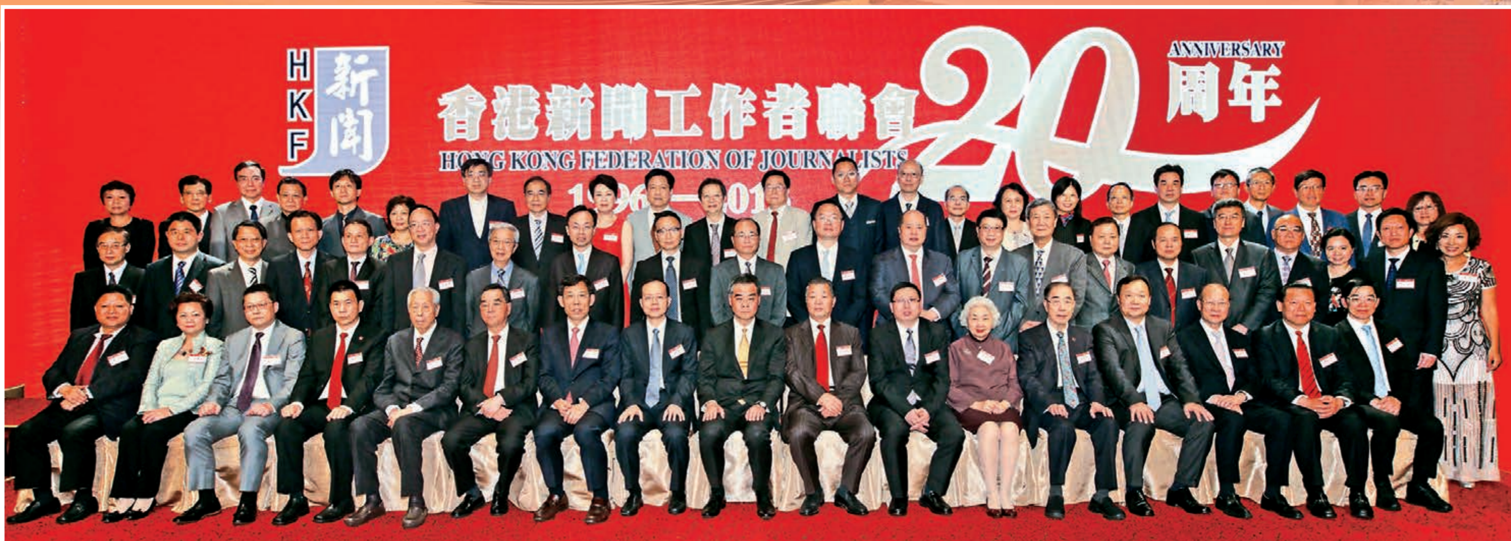
▲新聞聯晚宴嘉賓雲集，行政長官梁振英(前排中)、中聯辦副主任楊健(前排左八)、外交部駐港特派員公署副特派員宋如安(前排右七)以及新聞聯主席姜在忠(前排左七)、會長張國良(前排右八)等主禮嘉賓合照