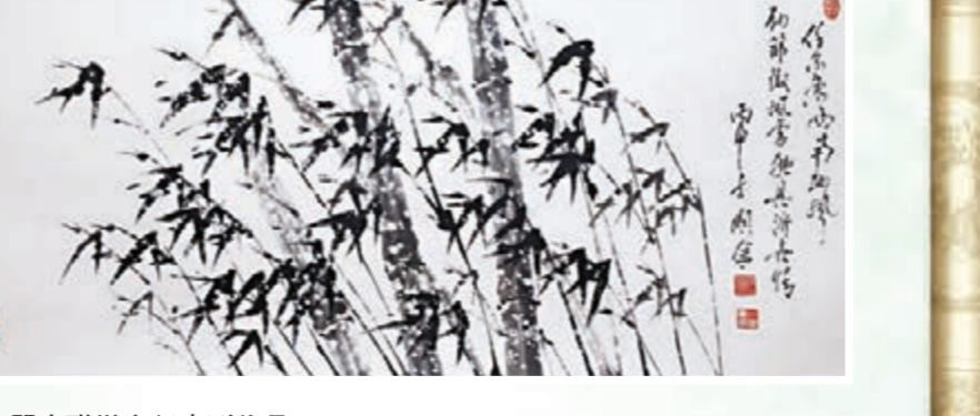
▲澳門中聯辦主任李剛作品