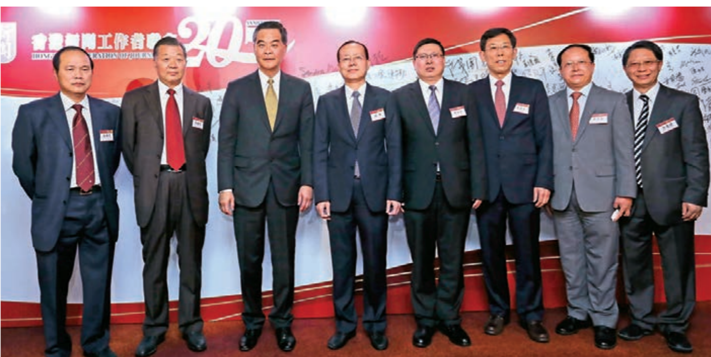
▲香港基本法委員會副主任梁愛詩蒞臨會場致賀