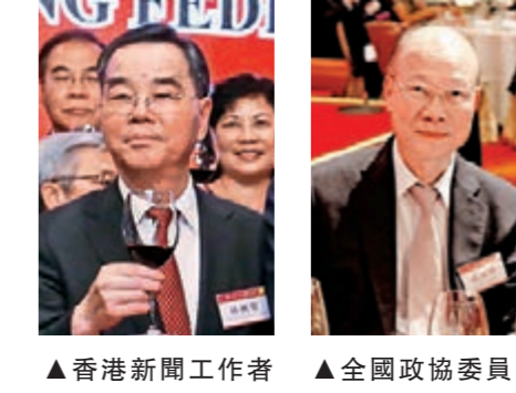
▲香港新聞工作者聯合會名譽會長、全國政協常委林樹哲蒞臨會場致賀