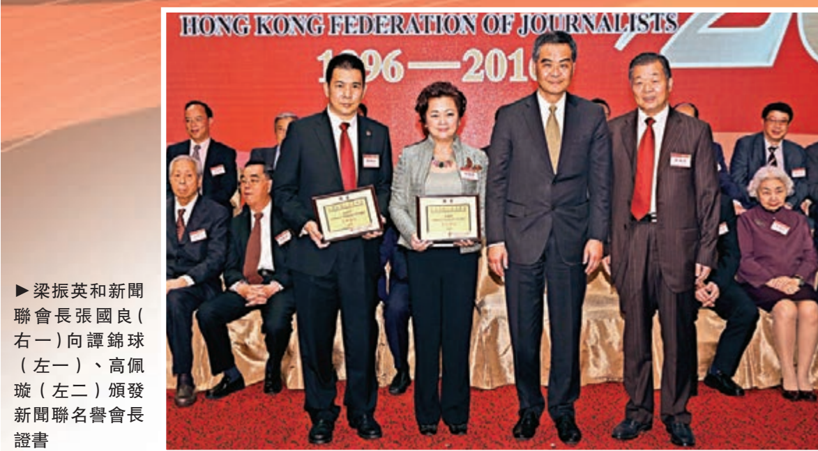
▶梁振英和新聞聯會長張國良(右一)向譚錦球(左一)、高佩璇(左二)頒發新聞聯榮譽會證書。