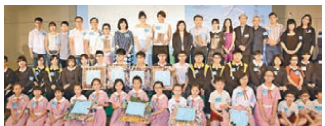
■梁詠琪宣揚環保訊息，分享環保心得。

香港文匯報訊（記者 梁靜儀）梁詠琪(GiGi)昨日到九龍灣出席港台《天人合一2016》啟播禮，宣揚環保訊息，活動上GiGi又分享環保心得，她謂平日與老公會吃女兒Sofia的剩菜，又會將舊衣物轉送朋友。GiGi表示已執了一袋中性BB衫給陀仔B的好友李心潔。