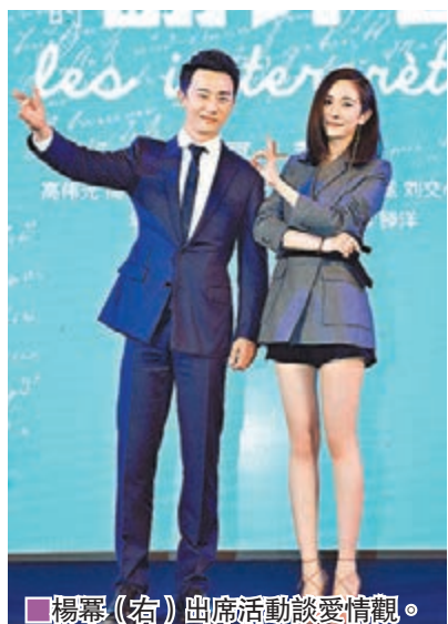
■楊冪(右)出席活動談愛情觀。

楊冪昨日親自否認婚變傳聞：「現在的狀況非常好，謝謝大家！」楊冪又以劇中角色的經歷來寄語她對愛情的看法，她說：「好的愛情，是兩個人可以共同成長，就像我今次角色童菲跟程家揚(黃軒飾演)一開始彼此走在一起，但後來發現對方是另一個世界的人，中間需要些磨合，好的愛情，就是讓這些磨合，成為彼此的經歷，接受這些東西再共同成長。」