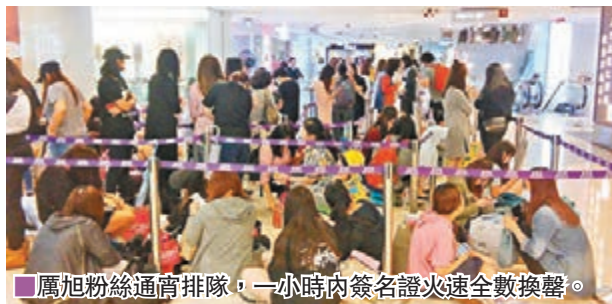
■厲旭粉絲通宵排隊，一小時內簽名證火速全數換罄。

此外，厲旭亦花心思拍了一段影片送給香港粉絲，片中他用流利的普通話自我介紹及大講「我愛你們」，又用韓語約大家本週日見面。