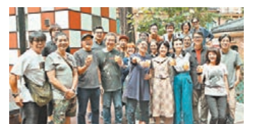
■《明月幾時有》殺青大家舉杯慶祝。

巧合殺青那天距離許鞍華導演5月23日的生日只差幾天，在殺青宴上，眾主創也為導演準備了生日蛋糕，一貫低調的許鞍華導演表示：「新片就是大家送給我最好的生日禮物。」問及她的生日願望，她表示願望就是「未來可以一直拍自己想拍的電影」。