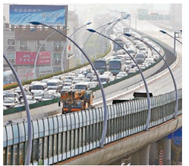
■受中環高架橋損壞事故影響,昨日起中環線真華路至萬榮路匝道之間封閉維修,周邊道路出現交通擁堵。

肇事卡車是上海建景物流公司的一輛裝載水泥打樁管的重型卡車滬D39066,該車輛不僅超載貨物而且違規駛上中環高架橋。