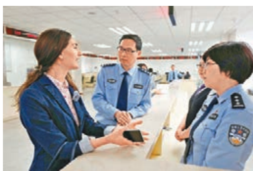
■中關村率先嘗試外籍高層次人才申請永久居留的便利政策。圖為一名外籍人士諮詢相關事宜。

香港文匯報訊 北京中關村要打造具有全球影響力的科技創新中心,迫切需要引進外籍高層次創新人才。今年3月,為推動國際型精英人才回流,中關村率先嘗試外籍高層次人才申請永久居留的便利政策,首批已有7人拿到了中國「綠卡」。