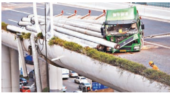
■肇事卡車失控撞上護欄,裝載的水泥管也紛紛滾落。中新社

上海中環當初設計是滿足城市快速道路需求,只允許小客車、客車通行。而該車上載有30多根長10餘米水泥打樁預製管,每根重量在2至3噸之間,加上車輛本身重量,重達逾100噸,而高架道路的國家標準限制載重量是在15噸以內,也就是說肇事車重量超出規定至少5倍之多。 事發目擊者表示,當時就跟在肇事卡車後行駛,目睹卡車上貨物堆積過高,導致頂端的水泥管掛到高架橋上的電線,最後圓柱體的水泥管無法保持平衡,加上當時卡車車速關係,最終使得卡車失控撞上護欄,車廂上裝載的水泥管也紛紛滾落,甚至還有一根滾下高架橋砸到地面道路,另外三根半懸在護欄邊緣搖搖欲墜十分危險。