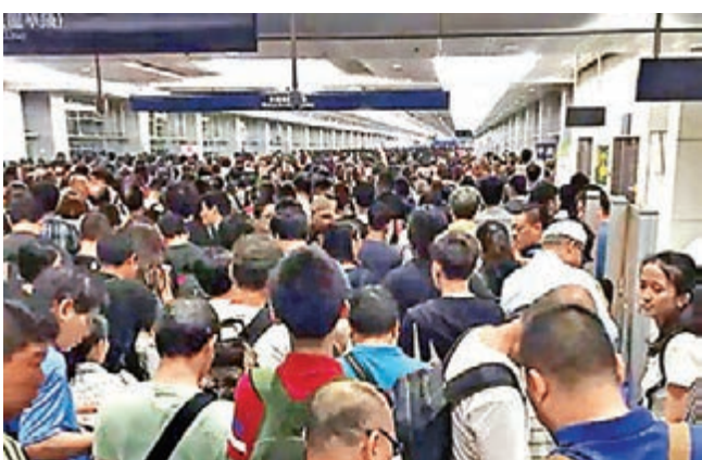
■22日晚大批旅客滯留深圳福田口岸,大量「水客」夾雜在普通旅客中利用周末集中過關造成口岸擁堵。網上圖片

香港文匯報訊(記者 何花 深圳報道)深圳福田口岸22日晚發生大批旅客滯留事件,其間有人用電棍打傷邊檢民警,一度引發口岸騷亂。深圳海關昨日對此事件回應稱,事發時海關正在進行打擊「水客」行動,大量「水客」夾雜在普通旅客中利用周末集中過關造成口岸擁堵,意圖趁旅客較多時逃避海關監管。記者了解到,襲擊民警的涉事「水客」目前已經被深圳警方拘留,被打民警則一直處於昏迷狀態。