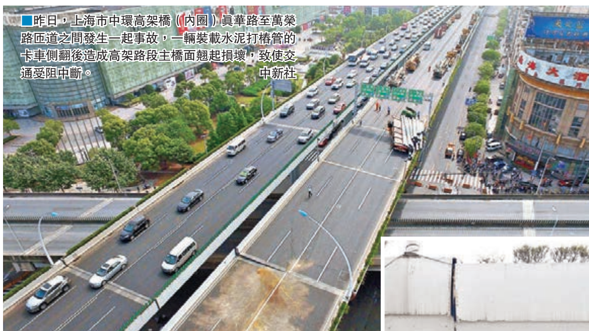
■昨日,上海市中環高架橋(內圈)真華路至萬榮路匝道之間發生一起事故,一輛裝載水泥打樁管的卡車側翻後造成高架路段主橋面翹起損壞,致使交通受阻中斷。

香港文匯報訊(記者 孔雯瓊 上海報道)昨日凌晨,上海中環高架橋遭超載重型卡車壓斷橋面,重達上百噸的事故車輛撞裂高架橋護欄,並導致路面開裂、脫離原來位置達半米,整個高架橋產生嚴重傾斜,事故中無人員傷亡。由於事發地點附近有不少居民住宅,不少人在睡夢中被撞擊造成的巨響和震動驚醒,稱當時感覺一陣「地動屋搖」,還以為是發生地震。