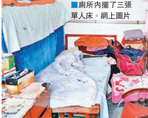
廁所內擺了三張單人床。

操勞的媽媽和出色的兒子，他們一路走來，感動了許多人，也得到了些資助。兩個兒子從本科到研究生，學費全靠助學貸款和助學金，如今讀研每月有幾百元生活補貼。在北京的小光做兼職、當家教，不需要父母給錢，小兒子需要的生活費也不多。