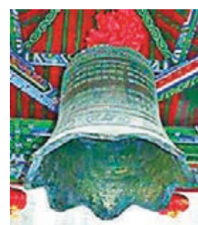
皇寺重鑄的大鐘。

位於瀋陽市和平區內的皇寺也稱實勝寺，始建於公元1636年(清崇德元年)，是清王朝在東北地區建立的一座藏傳佛教皇家寺院。寺