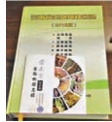
雲南發佈的新版生物物種名錄。

《雲南省生物物種(2016版)》收錄雲南省25,434個物種，其中，大型真菌2,729種，佔全國的56.9%；地衣1,067種，佔全國的60.4%；高等植物19,365種，佔全國的50.2%；脊椎動物2,273種，佔全國的52.1%。經初步核實，雲南有國家重點保護野生動物153種，約佔全國的41.6%。其中國家一級重點保護野生動物45種，國家二級重點保護野生動物108種。有國家重點保護野生脊椎動物242種，約佔全國的57.1%。