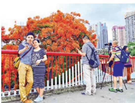
珠江上鳳凰花新增一景，引來恩愛夫妻幸福自拍。

如傾如注的龍舟水，如火如荼的鳳凰花。近幾天，在廣州珠江上的海印橋西北側的一棵鳳凰木，一夜之間花團錦簇，如綻放在橋上的煙火，引得羊城市民不僅紛紛前往觀賞、拍照，更讓不少遊客「詩意」大發，在社交圈寫下詩詞、小文，諸如「鳳凰花開的消息」，引起共鳴。