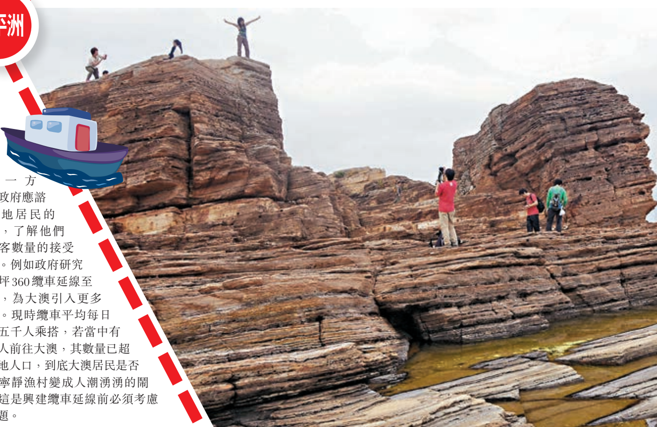
東平洲是香港地質公園，假日有大量遊客前往觀看獨特地貌，但島上卻只有約十戶村民定居。圖為東平洲的更樓石。資料圖片

有大澳居民表示對延線有顧慮，指出大澳在假日時已被旅客迫爆，設施更顯不足，除了交通配套以外，廁所、泊車位等基本建設也無法容納更多旅客，而遊客增加亦會令租金和物價上升，影響居民生活。