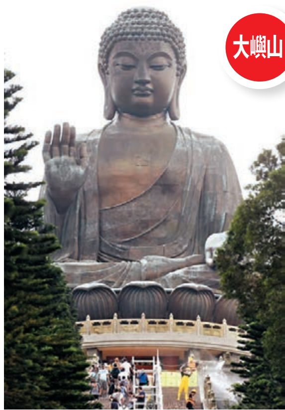
天壇大佛和寶蓮寺都是香港知名景點，位於大嶼山西部昂坪。