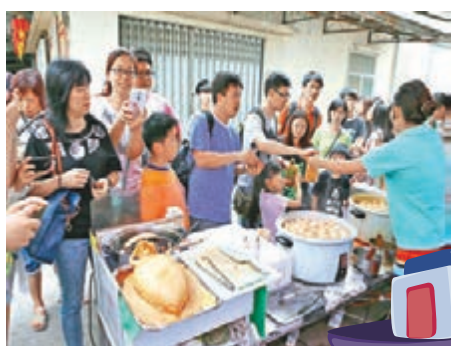
大澳在假日時也有大量遊客前往，為居民帶來不便。圖為遊客購買當地小吃。

現時長洲和大澳等離島地區，居民正承受着過度發展旅遊業所帶來的負面影響。由於遊客數量過多，令他們無法乘搭交通工具，部分居民甚至因路面擠迫而不想外出，反映了離島旅遊發展未能顧及社區需要。故此，推廣離島旅遊不能只着眼於興建交通和娛樂等基礎設施，也要評估當地有沒有足夠的空間容納遊客，從而設定遊客數量上限。