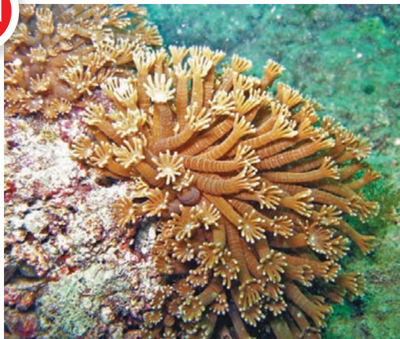
海岸公園在假日時吸引不少市民前往潛水，部分地方發展出針對潛水人士的經濟，如出租潛水裝備等。圖為橋咀洲的珊瑚。資料圖片