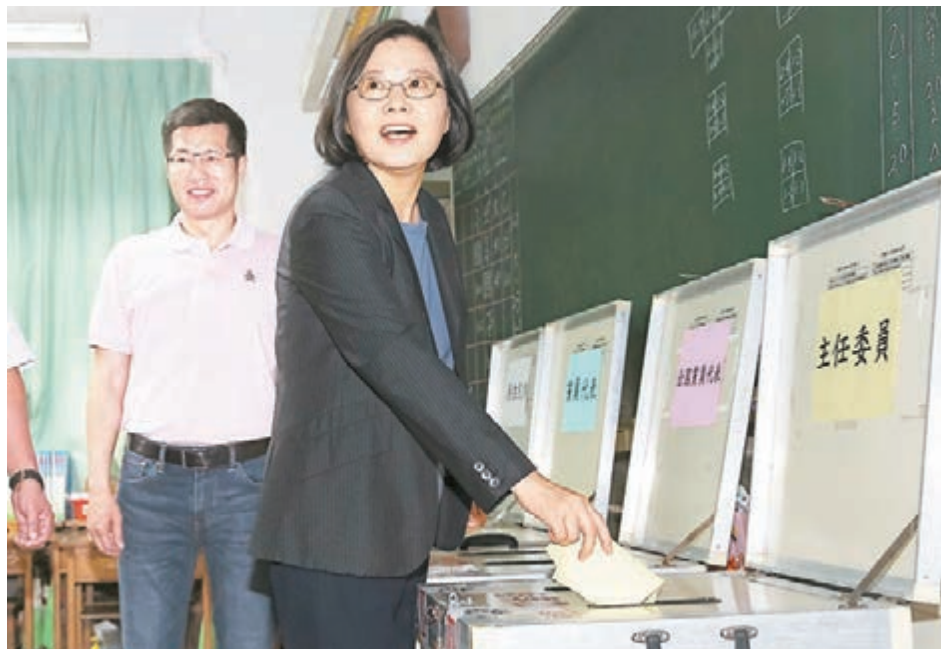
■蔡英文在「就職演說」中迴避「九二共識」。圖為蔡英文昨日前往民進黨新北市黨部黨改選投票開票所投票。

郝龍斌期許民進黨要放下意識形態，讓兩岸關係能夠順利、和平、穩定的發展，讓蔡英文在就職演說中揭示出來的各個方向能夠順利達成，讓台灣經濟能夠變好、兩岸能夠穩定、民眾生活能夠改善。