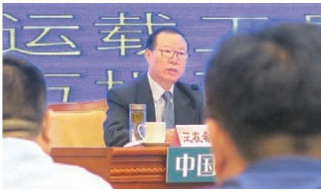
■王在希認為，民進黨是可爭取分化的政黨，它不是鐵板一塊。 中央社

香港文匯報訊 全國台研會副會長王在希21日在一場研討會上透露，一旦蔡英文不願承認「九二共識」，兩岸可能越走越遠，如此一來，大陸可能採四大策略對付台灣新當局，包括政治上分化、軍事上威懾、經濟上融合、外交上佈局。此外，台灣亞太和平研究基金會董事長趙春山昨日表示，大陸方面不會給蔡英文當局太多時間，也不願在「九二共識」這個問題上糾纏太久，希望盡快把兩岸關係定性。