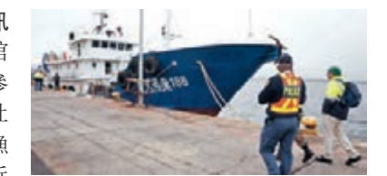
■被扣押的中國漁船。

香港文匯報訊 中國駐南非大使館新聞發言人余勇參贊22日向新華社證實，一艘中國漁船日前在南非附近海域被南非執法部門查扣，中國駐南非大使館正就此事與南非方面溝通。