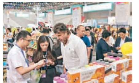
■市民在渝洽會上購買進口產品。