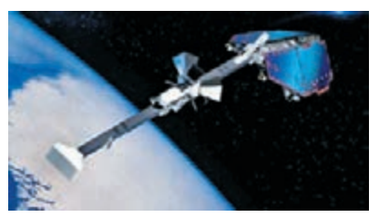
■量子通信衛星想像圖。網上圖片

香港文匯報訊 據中通社報道，中國首個量子衛星將在今年7月份發射，發射成功後將可以實現全球的高技術通信。