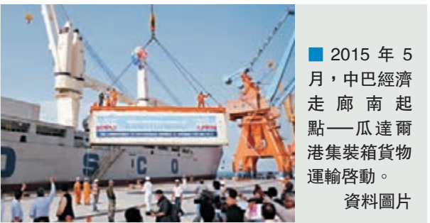
■2015年5月，中巴經濟走廊南起點—瓜達爾港集裝箱貨物運輸啓動。