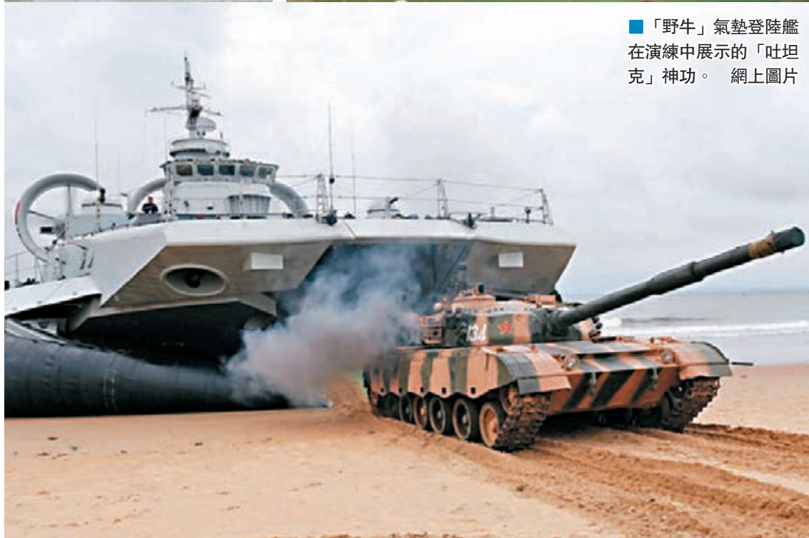
■「野牛」氣墊登陸艦在演練中展示的「吐坦克」神功。網上圖片