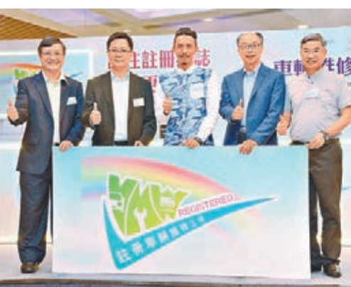
左起:彭耀雄、薛永恒、張繼聰、陳帆、李耀培合照。

香港文匯報訊(記者 文森)機電工程署昨日舉辦「車輛維修工場自願註冊計劃」推廣日,運輸及房屋局表示,至今約有1,000間車輛維修工場在新計劃下獲批註冊;註冊車輛維修工場須承諾經營質素不低於「車輛維修工場實務指引」要求,並須聘用註冊車輛維修技工、設有牢固上蓋的工作車位,以及接受計劃下的投訴處理機制和決定。