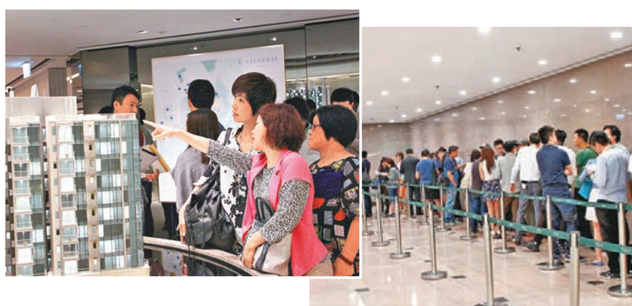
SAVANNAH參觀者持續不斷。

會德豐地產(市務)助理總經理何詠儀指,今次的登記當中有20%為新登記者,其餘為首兩輪向隅者。黃光耀表示,該盤買家佔逾半數是年輕人買樓上車,年齡介乎25歲至34歲,投資者比例不多於20%。