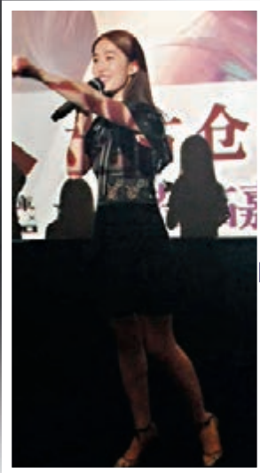
事前，劉亦菲非躍地跟影迷互動。