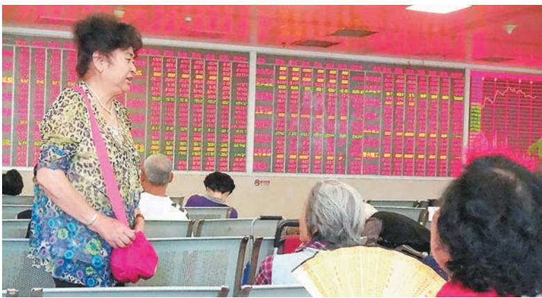
受累於大金融板塊等權重股的低迷,滬指收市跌0.02%,報2,806.91點。圖為成都某證券交易所大廳內的股民。