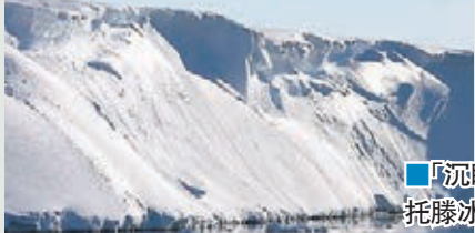
「沉睡巨人」托滕冰川