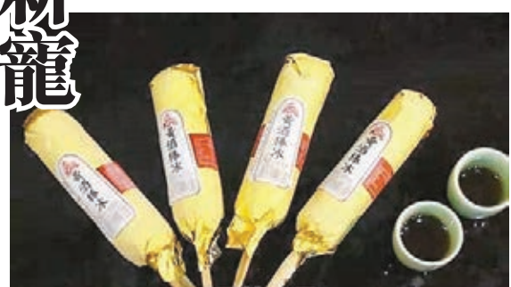
■土豪金黃酒雪條一面世即受年輕人追捧。 本報浙江傳真