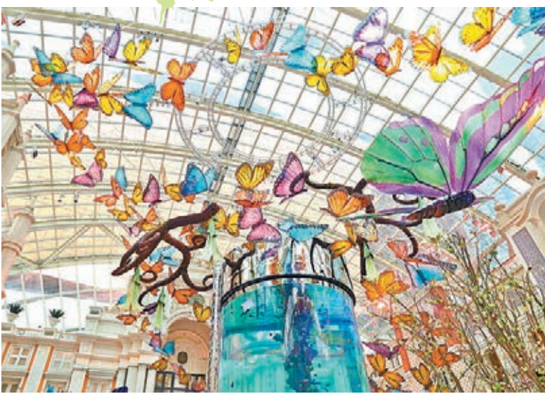
■天幕廣場回歸「翻蝶世界」。

大型蝴蝶紛飛裝置吊飾是美高梅最受歡迎的主題設計之一，現正回歸到天幕廣場，再次重現當年的盛況！超過160件由有機玻璃製成的帝王斑蝶及閃蝶裝飾品栩栩如生地於月桂枝及曼陀羅花裝置品間穿梭起舞。