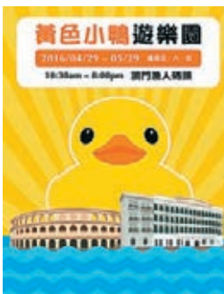
■「黃色小鴨遊樂園」遊園會約定你。

開放日期：5月20至22日、5月27至29日（每星期五至日） 開放時間：上午10時30分至晚上8時 地點：澳門漁人碼頭