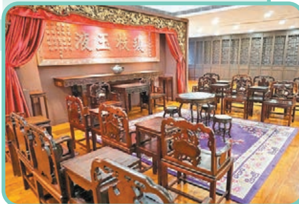
■澳門茶文化館定期舉辦以茶文化為主題不同活動，展示澳門茶文化以至中西茶情。