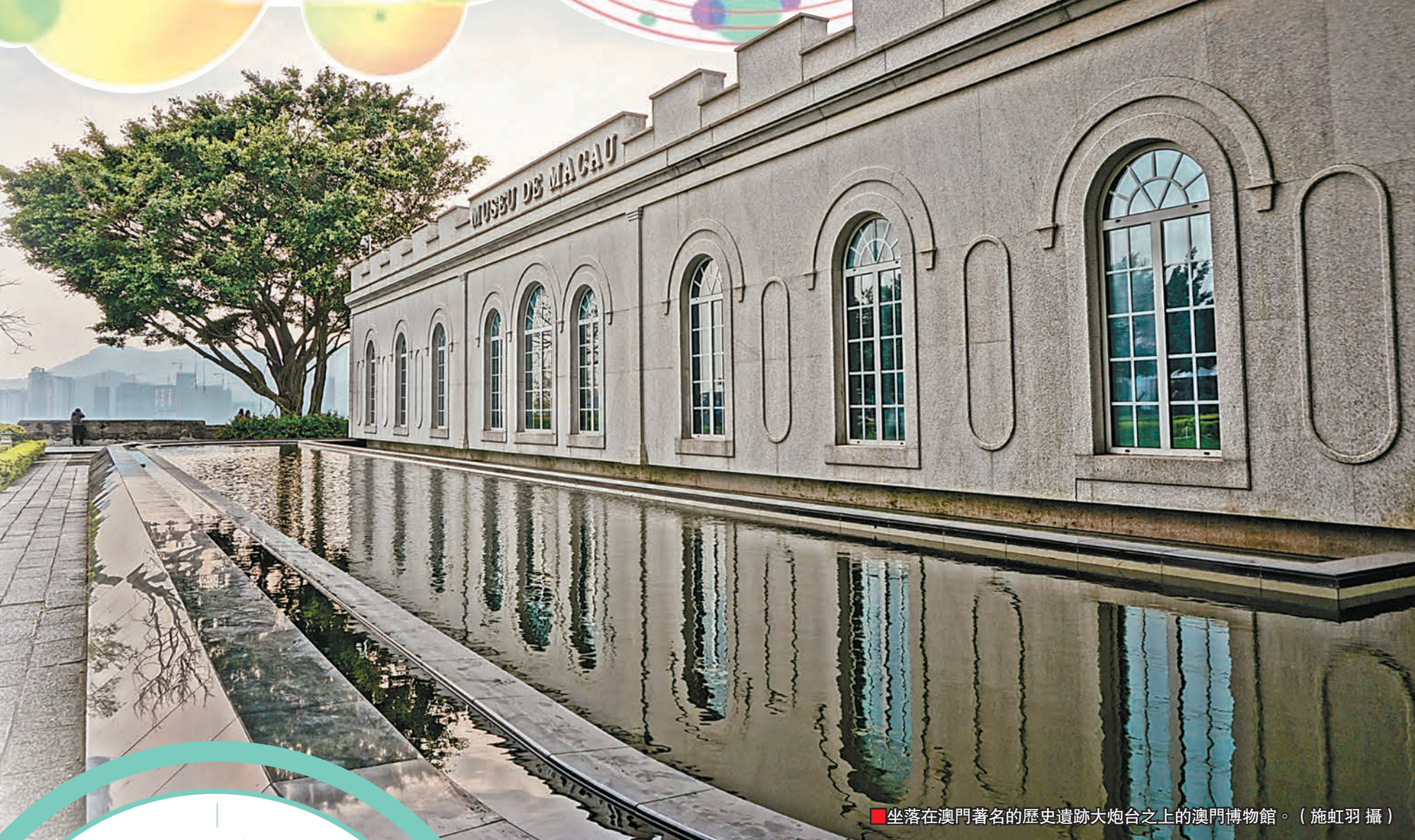
■坐落在澳門著名的歷史遺跡大炮台之上的澳門博物館。