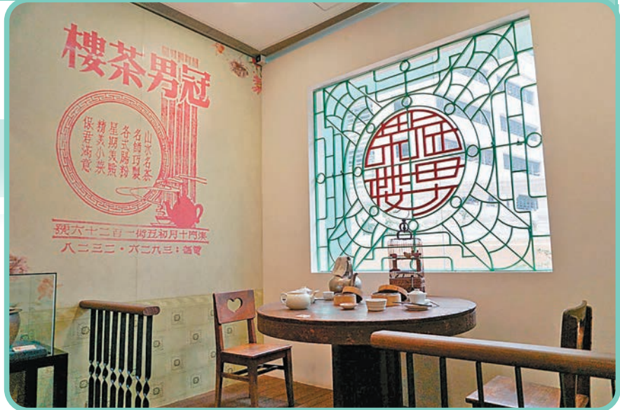
■澳門茶文化館是全澳首座以茶文化為專題的博物館，圖為昔日澳門著名的冠男茶樓場景再現。