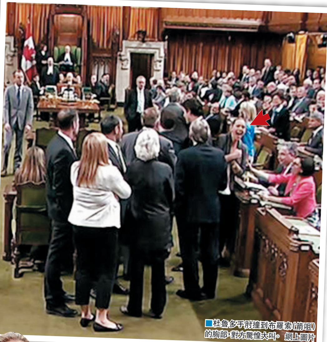
杜魯多手肘撞到布羅索(箭咀)的胸部,對方驚惶大叫。