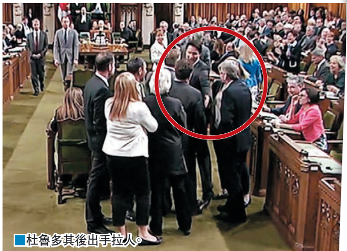
杜魯多其後出手拉人。