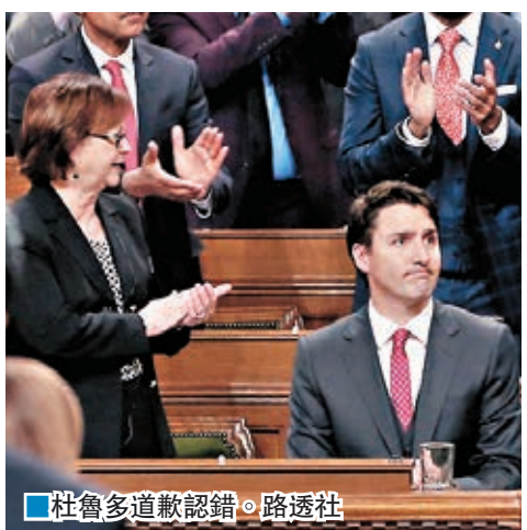
杜魯多道歉認錯。

坐在杜魯多對面的保守黨議員希爾形容,當時杜魯多怒髮衝冠,明顯失去冷靜,形容對方「不像政要應有表現」。有反對黨議員透露,杜魯多衝向人群時曾爆粗,怒叫「他媽的別擋路」(Get the f**k out of the way);這令人想起杜魯多父親老杜魯多擔任加國總理時,1971年在下議院涉嫌作勢爆粗引發的