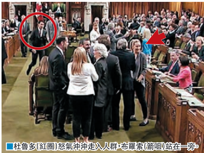
杜魯多(紅圈)怒氣沖沖走入人群,布羅索(箭咀)站在一旁。