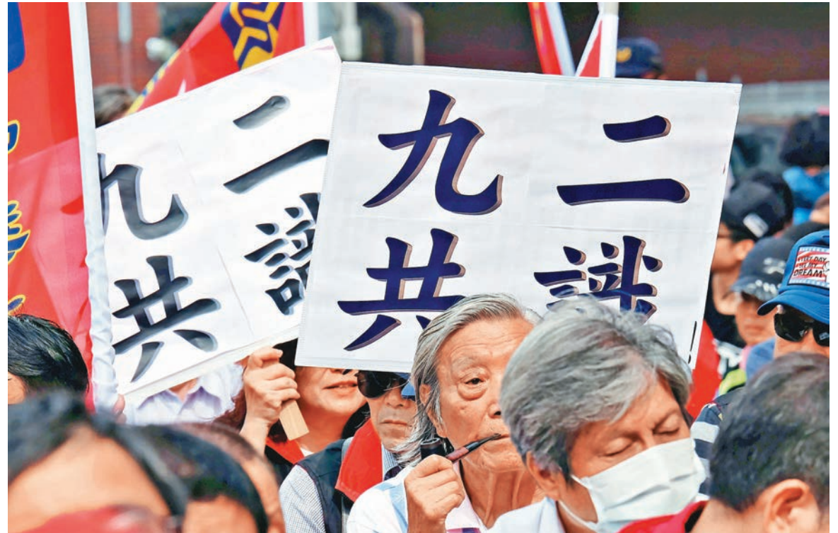
■相關人士表示，只有兩岸關係和平發展，旅遊業才能受惠。兩岸關係不好，不僅是觀光業，其他行業也受波及。圖為早前台灣民眾於街頭高舉標語，望新當局堅持「九二共識」。