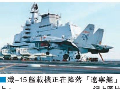
殲-15艦載機正在降落「遼寧艦」上。網上圖片

香港文匯報訊 綜合《解放軍報》、新浪網報道，《解放軍報》日前披露了中國第一艘航母「遼寧艦」的最新狀態，稱「遼寧艦」與殲-15的融合訓練「提速」，該艦航空部門一天保障的殲-15艦載機起降架次數量，已是過去一天的數倍。