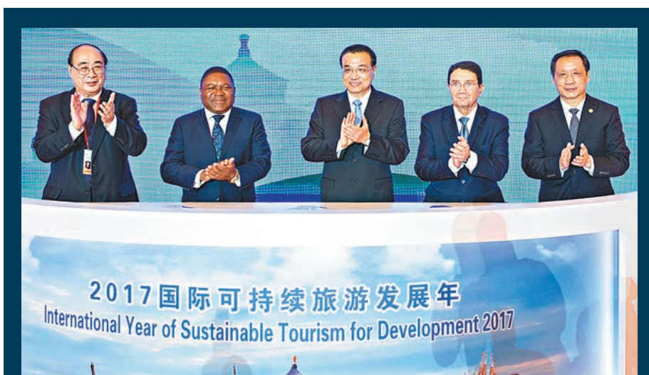
李克強昨日在北京人民大會堂出席首屆世界旅遊發展大會開幕式並致辭。新華社

瑞法依表示，使旅遊業對減貧的貢獻最大化，是聯合國世界旅遊組織的優先考量和重點工作之一。在第十三年五個五年規劃期間，中國發起一個全國範圍的旅遊發展計劃，爭取到2020年，使17%的中國貧困人口擺脫貧困。而聯合國世界旅遊組織可持續旅遊消除貧困計劃，支持那些為每日生活不足1美元的人創造工作機會並推動發展旅遊活動。