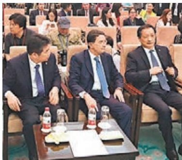
李金早(右一)與世界旅遊組織官員(右二)進行交流。

首屆世界旅遊發展大會後，國家旅遊局與世界旅遊組織聯合召開新聞發佈會，並通報了昨日大會的情況。國家旅遊局局長李金早首先用中文介紹了參會人員。而正當翻譯打算翻譯時，李金早突然打斷並用英文向媒體進一步補充了政府高官參會情況，現場有外國記者紛紛流露出驚訝的表情。隨後，當有記者提問如何建設「美麗中國」時，李金早現場用英文簡單介紹了美麗中國的定義，以及中國為提升旅遊形象做出的努力，並鼓勵外國遊客來華旅遊，引得現場一片掌聲。