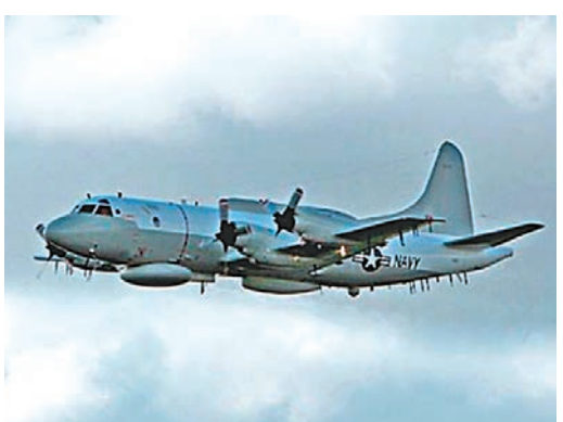
美國EP-3偵察機。資料圖片