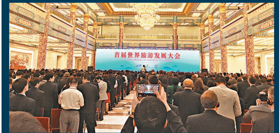
首屆世界旅遊發展大會開幕式現場。