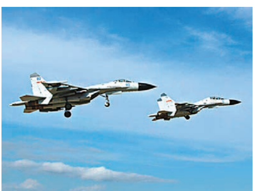
中國殲-11戰機。資料圖片

據中國外交部網站報道，中國外交部昨日下午舉行例行記者會，發言人洪磊回應媒體相關提問時表示，經向中方有關部門了解，美方有關說法不實。17日，美軍一架EP-3偵察機抵近中國海南島附近空域實施偵察活動，中國2架軍機依法依規進行跟蹤監視，並一直保持安全距離，未採取危險動作，中方有關操作符合專業和安全標準。