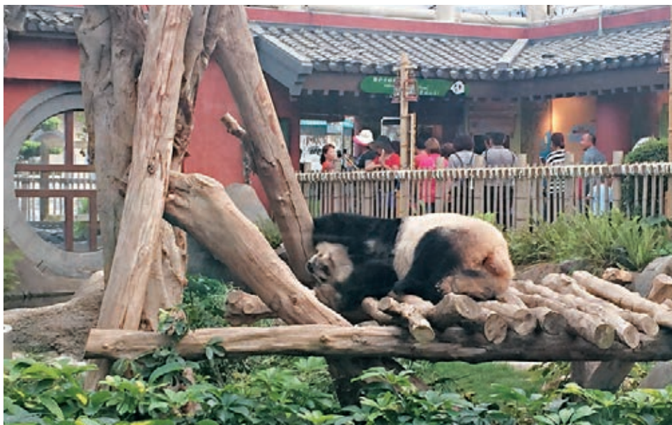
■雌性大熊貓盈盈去年10月一度懷孕,但胎兒在後期被母體吸收,港人只好寄望牠下次的懷孕機會。

被問到上海迪士尼在下月中旬啟幕,李繩宗認為,內地人均收入增加,對主題樂園的需求亦相應提高,加上他們人口龐大,相信市場能容納不同主題樂園,並令主題樂園成為主流消閒活動,故此不擔心。