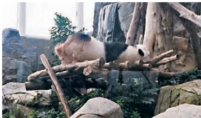
■園方將取用樂樂活躍的精液。