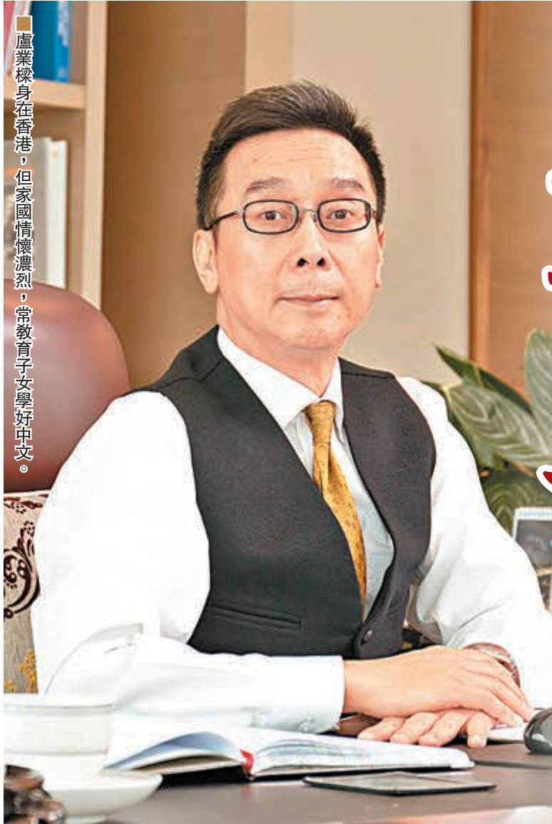
盧業樑身在香港，但家國情懷濃烈，常教育子女學好中文。