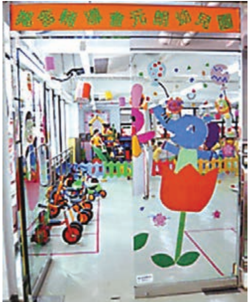
校方負責人表示「拐子佬爸爸」事件已交予警方處理。