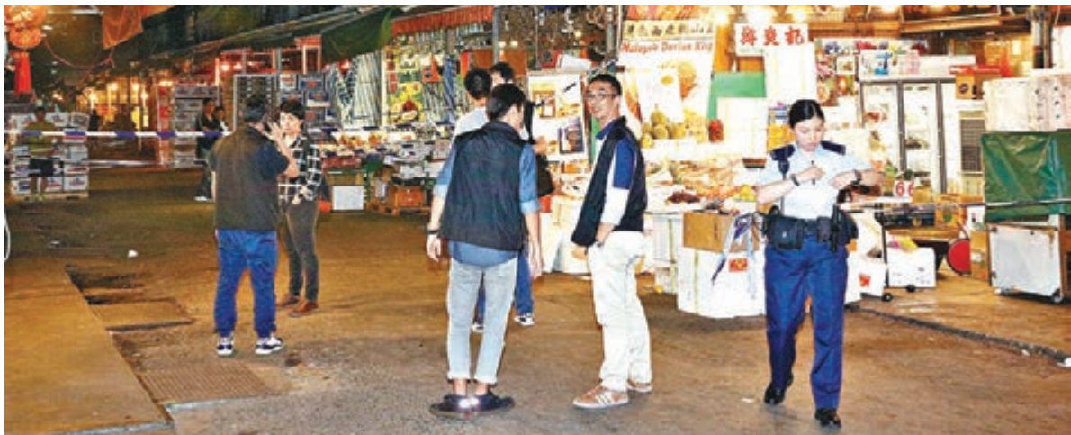
大批警員到果欄血案現場調查。

香港文匯報訊(記者 杜法祖)油麻地果欄一間有逾60年歷史的老店,昨晚突遭5名刀手掩至施襲,店主兒女及女婿同中刀浴血,刀手兇後乘車逃去,只遺下一柄兇利利刀,警員正追緝涉案刀手下落,並調查血案背後動機。