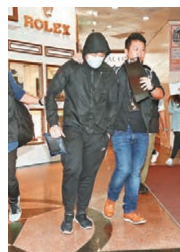
另一名男職員亦涉不良營商手法被海關拘捕。劉友光 攝