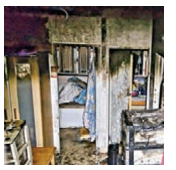
太安樓失火單位嚴重焚毀。

香港文匯報訊(記者 杜法祖)西灣河太安樓一單位昨午疑因洗衣機過熱失火焚宅,有鄰居一度企圖拖喉救火救人未果,終需消防員趕至破門救出一名被困女住客,她昏迷送院搶救後性命垂危,其所飼養的兩貓一狗葬身火海。