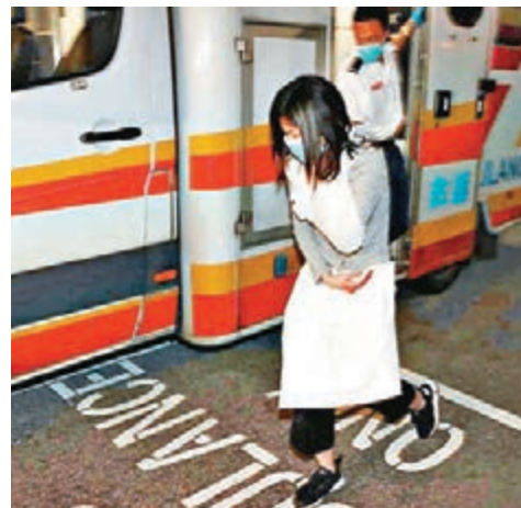
女傷者員傷送院治理。

案發於昨晚7時許,5名刀手突乘車而至闖店襲擊,正準備收檔的檔主兒子、女兒及女婿一度以發泡膠箱、紙皮箱等擋格,但兒子終被斬傷頸部,女兒一隻手指亦幾乎被斬斷,其夫額頭受傷,3人送院後初步沒有生命危險。警方事後在現場檢獲一把包有紗布的呎長利刀。