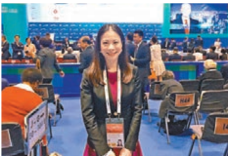
陳曼琪出席「一帶一路高峰論壇」，對張德江的勉勵感到鼓舞。