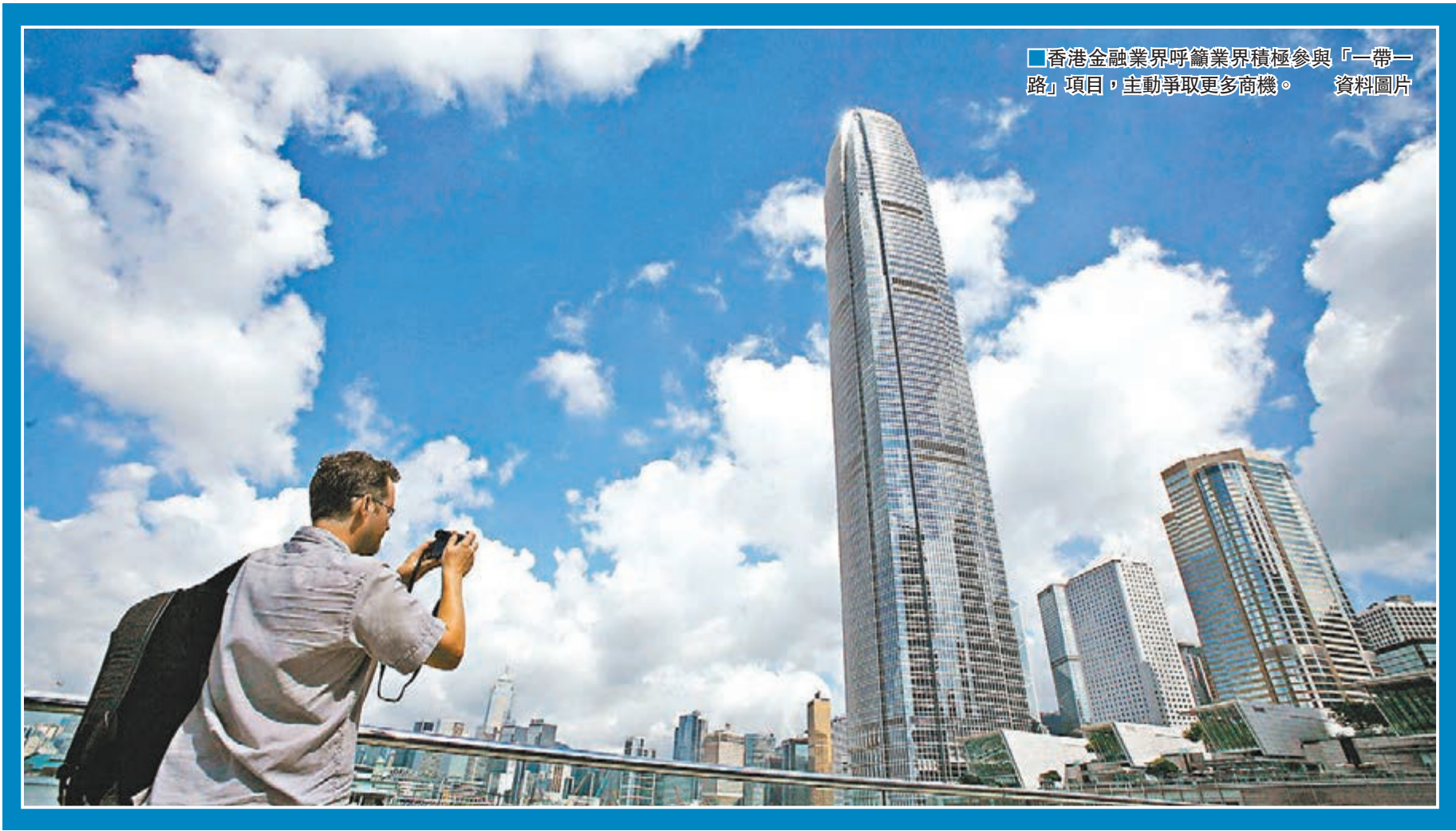
香港金融業界呼籲業界積極參與「一帶一路」項目，主動爭取更多商機。 資料圖片