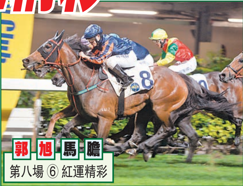
郭旭馬膽 第八場 ⑥ 紅運精彩

段透出後員注力源源不絕，戰鬥力明顯又昇華至另一層面，體形健壯負重磅料也不礙事，沿留三班篤定贏多次。「嘉應小子」養回良好健康，近仗表現越來越好，季內少搏體力較對手佔優，在季尾足以轉化成爭勝原動力。「精壯神駿」上賽完全埋唔到「變出美態」身得季軍，實力有明顯分野，乘旺態大勇也限爭驕。再揀兼顧「勇創潮流」。