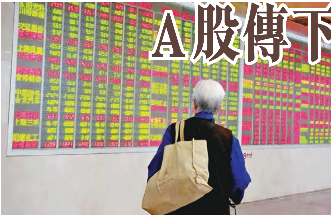
▲A股昨衝高受壓，截至收盤，滬指報2,843點，跌幅0.25%。