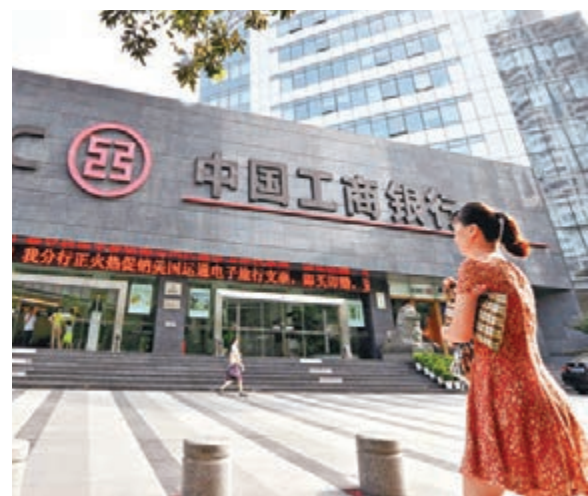
■工行表示自6月1日起不再受理新的個人賬戶綜合理財業務。資料圖片

香港文匯報訊 工商銀行(1398)昨晚表示自今年6月1日起，不再受理新的個人賬戶綜合理財業務，引發了市場廣泛關注。業內人士指出，此項業務並非普通銀行理財業務，而是「存貨通」業務，因替代性產品較多，缺乏吸引力而促成前述產品終止。工商銀行公告亦稱，對於已簽訂協議的客戶，將不再受理展期業務，業務停辦一年後存量客戶協議將全部終止。