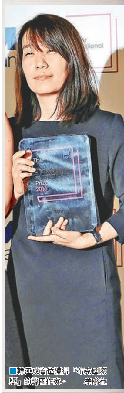
韓江成首位獲得「布克國際獎」的韓國作家。

韓國當紅女作家韓江，前日憑小說《素食主義者》獲得英國文學界大獎「布克國際獎」，是首位獲得這個獎項的韓國作家。《素食主義者》講述一名韓國婦女因心理陰影抗拒食肉，甚至希望變成植物的故事，去年翻譯成英文出版後掀起熱潮。韓國文學界認為，韓江得獎將成為韓國文學作品再次騰飛的契機。