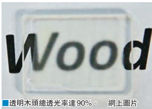
透明木頭總透光率達90%。網上圖片