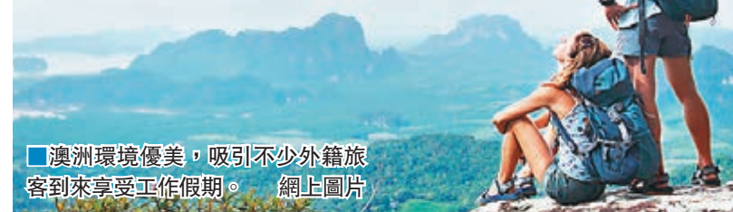
澳洲環境優美，吸引不少外籍旅客到來享受工作假期。

國庫部長莫里森本月初宣佈的今年財政預算案中，建議向旅客工作假期的所有收入徵稅32.5%，取消現行每年少於1.8萬澳元(約10.2萬港元)收入毋需繳稅的做法，以改善澳洲的嚴重財赤。然而，有關決定引起農民不滿，指會難以聘請工作假期旅客協助收割，更在網上聯署要求莫里森取消計劃，截至昨日已獲近4.8萬人支持。當局昨日表示，政府將檢討鄉郊和社區的勞動力問題，到今年10月或11月會重新考慮這個稅項。 ■《每日電訊報》/《悉尼先驅晨報》