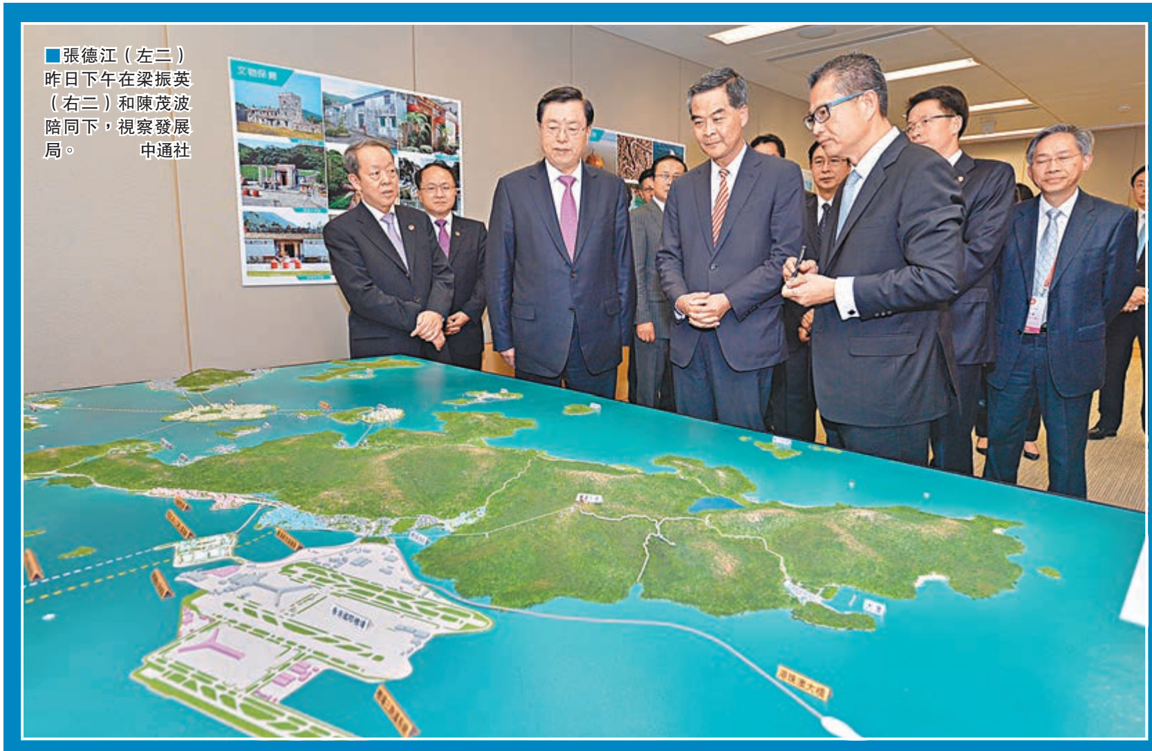
張德江(左三)昨日下午在梁振英(右二)和陳茂波陪同下,視察發展局。

特區政府更特設由行政長官梁振英親自主持的「一帶一路」督導委員會,負責制定香港參與「一帶一路」的策略,並設立「一帶一路」辦公室,推動研究工作及統籌協調相關政府部門和機構,更積極地發揮推動作用。