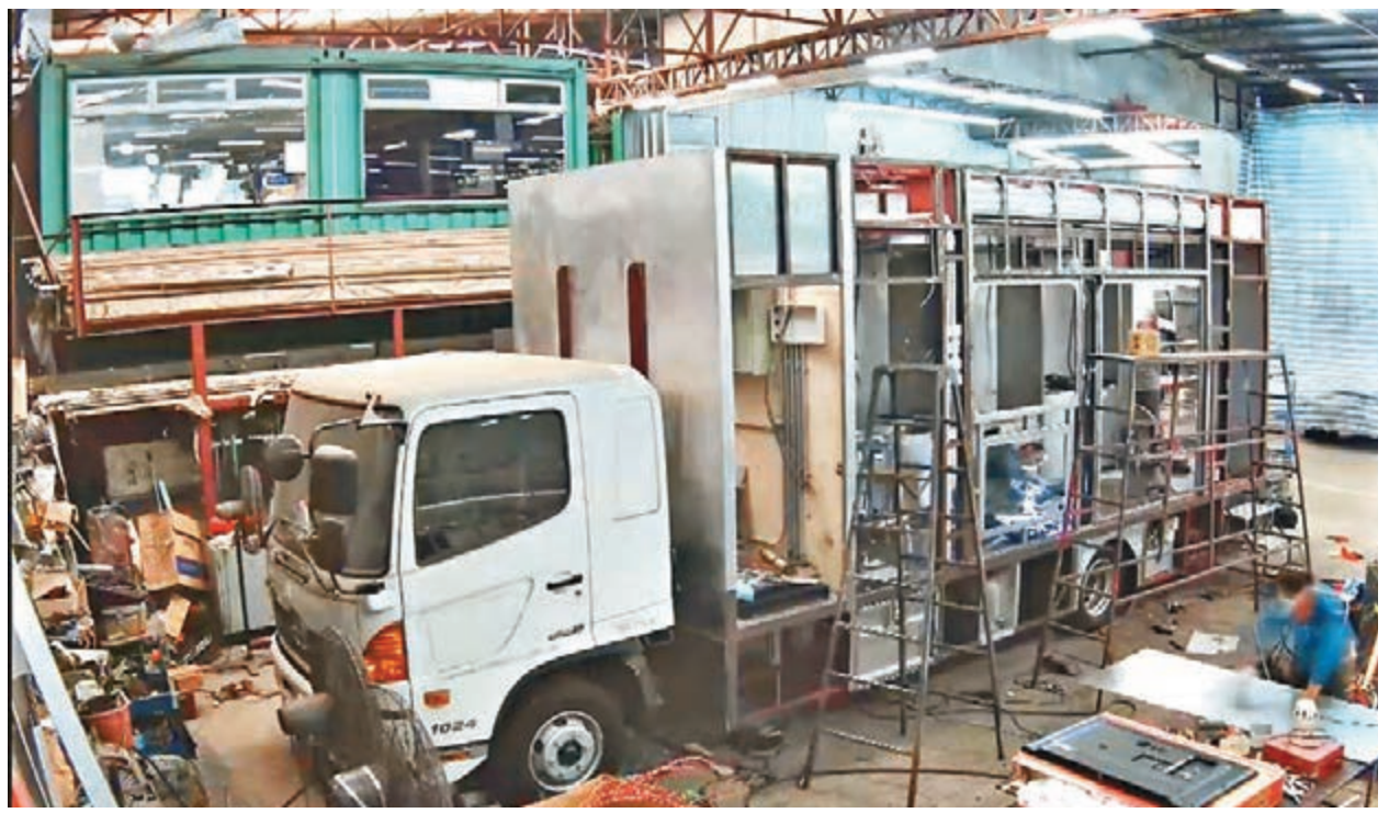
收銀車原來是金管局在世界首創,圖為當時改裝情況。

至於內地電動兩輪車品牌雅迪集團(1585)已截止公開發售,市傳公司未獲足額認購,惟因配售已超額,足以彌補公開發售之不足,故會如期於本月19日,即下周四掛牌。保薦人為中信建投國際,安排行尚有摩根大通、華泰金融、同人融資。