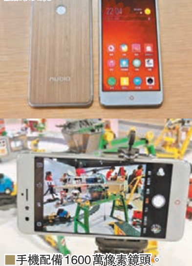
手機配備1600萬像素鏡頭。