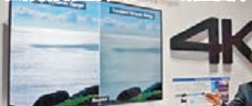
在HDR(左)幫助下，畫面光暗位有着更佳表現。

但無論標清、高清、全高清抑或超高清，當中都會牽涉到片源這回事，所以攝錄器材與觀看用的顯示器皆缺一不可；始終4K電視是無法把一般高畫質影像呈現最佳效果。要真正觀賞「真4K」，並非單純買部4K電視把現有標清或高畫質畫面倍線(Upscale)，而是需要對應HDR(High Dynamic Range 高動態範圍影像)規格的4K電視、支援4KHDR藍光影碟的播放器(並非採用特別壓縮方式的「假4K影碟」)和備有對應HDR規格的片源；若觀賞下載或串聯檔案，那當然也是要HDR版本。