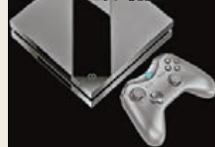
戰斧F1被戲謔是PS4和Xbox One的混合體。

在現役家用機開始攀至頂峰之際，內地廠商Fuze日前突然宣佈也推出遊戲機「戰斧F1」，入門「暢玩版」售價899元人民幣，並已接受預購最快下月1日派貨。在日前的發佈會中，得知這部新機採用Android系統，並得到Tecmo Koei和Deep Silver等公司支持，還請來「洛克人之父」稻船敬二替其站台。事實上這一點也不出奇，因稻船去年在Kickstarter集資之作《Red Ash》未能達標，最終由Fuze「買單」，換言之等同戰斧F1買起了該遊戲。另外，網民指戰斧F1的主機酷似PS4，而手掣則類近Xbox One，未免有欠原創性云云。