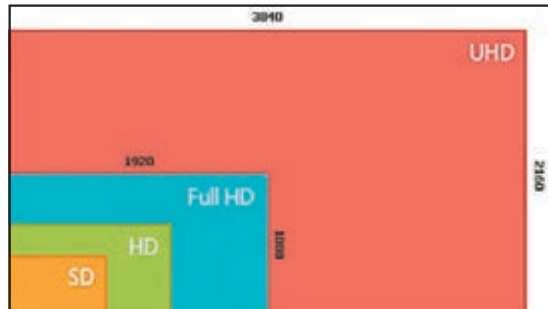
4K(淺紅色範圍)解像度為全高清(藍色)的4倍。