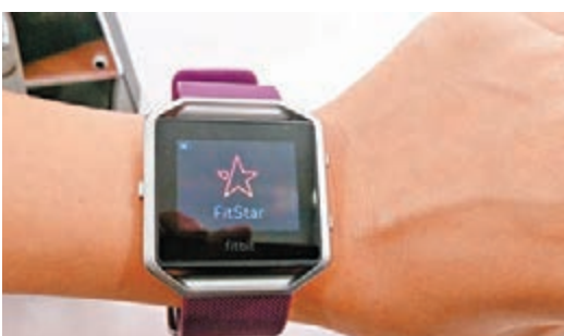
FitStar個人訓練員屏幕鍛煉。

幕鍛煉，它提供3套FitStar最受歡迎的個人訓練員鍛煉健身指引和動態畫面，如8分鐘熱身、7分鐘鍛煉、10分鐘腹肌Abs，每套鍛煉均是免費提供，可於任何地方隨時收看，無需經由智能手機或下載軟件，方便快捷。而且Blaze又具備必須智能通知設計，如來電通知、文字通知及日程提示，讓用戶時刻聯繫無間，不會錯過任何重要約會或通訊。至於其特長電池使用時間，一次充電可運作5天。 零售價：$1,598