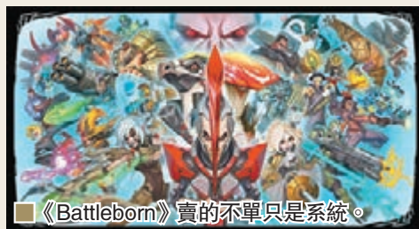
《Battleborn》賣的亦單只是系統。

《Battleborn》的最大賣點，是來自五大系統的合共25名可使用角色，喜歡近身格鬥、遠距離射擊或奇招突擊等各適其適，而且設計上富有科幻風格，畫風亦與其未來世界背景很匹配。 零售價：$428(PS4、Xbox One)