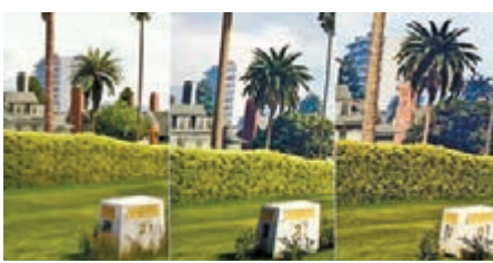
在遊戲界，畫面由高清、全高清進化為超高清(左至右)出現了明顯分別。