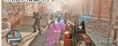
《Homefront: The Revolution》和前作相當不同。

本月17日發售的《Homefront: The Revolution》，是五年前主觀射擊佳作《Homefront》的延續篇，但基於原來的發行商THQ已被破產，版權已轉落入Deep Silver的手上。雖然劇情仍是抵抗朝鮮入侵者，以虛構的2029年近未來費城作背景，但這次玩法改為開放式世界，和前作類似《Call of Duty》的過關式劇情有點不同；當然重視多人連線對戰才是其最吸引之處。 零售價：$398(PS4、Xbox One)