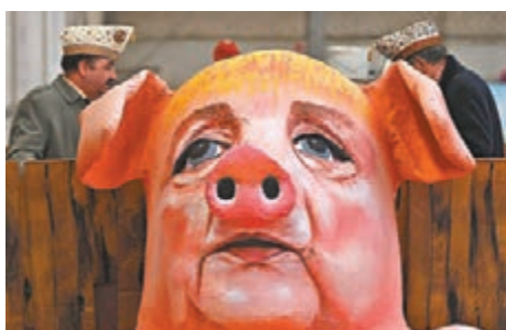
民眾多番以豬頭抗議默克爾。

肇事的選區辦公室位於施特拉爾松德市，默克爾從1990年開始，一直贏得這選區的直選議席。前日早上約5時40分，巡邏警員發現豬頭和抗議標語，警方只透露抗議標語內容是針對默克爾的「侮辱性言論」。由於此舉涉嫌對總理不利，並違反德國有關動物屍體清理的法例，警方因此展開調查，至今未發現涉案疑犯。今次已非默克爾首次被人用動物抗議，今年2月有不