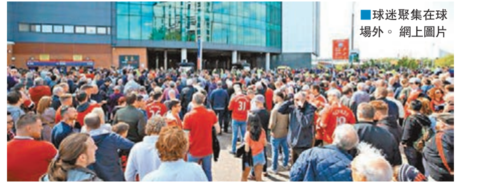
球迷聚集在球場外。