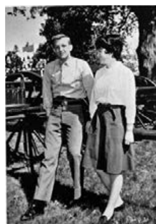
求學時期曾違規帶美女回校。

受訪者有特朗普高中同學、前女友、公司下屬、工作夥伴及選美冠軍等。她們有些對特朗普嗤之以鼻，認為他幼稚；有些則認為特朗普是「女人湯丸」；但也有些認為特朗普是她們工作上的伯樂，助她們在男性為主的職場「上位」，與主流看法大相逕庭。