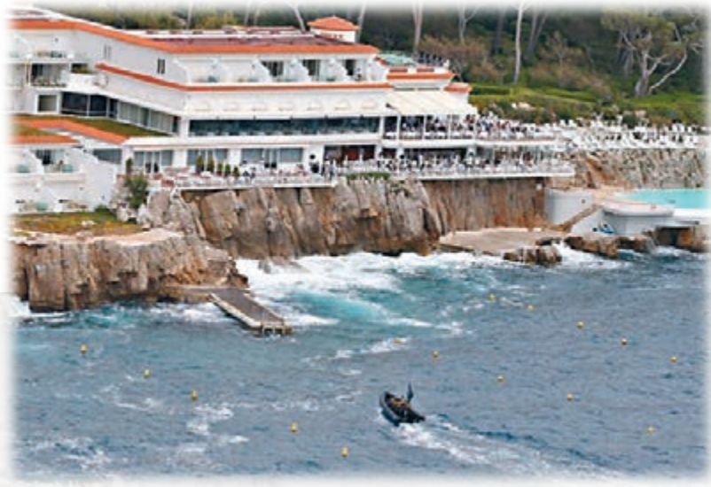
酒店一名客人指，該6人穿軍服及蒙面，駕駛橡皮艇高速駛近酒店，令部分在場賓客非常驚恐，立即逃離座位奔向酒店泳池區域。警方指，這批演員早前試圖闖入康城附近封鎖水域，遭當局驅趕，今次則在酒店碼頭泊岸，警方截停並扣押橡皮艇，但未拘捕涉事者。

法國新創網購公司Oraxy上周五聘請6名演員，假裝向康城影展名人下榻的酒店發動恐襲，試圖製造宣傳效果。由於當日正是巴黎恐襲後首個「黑色星期五」，加上「恐怖分子」乘坐的橡皮艇掛上黑色旗幟，酷似極端組織「伊斯蘭國」的標誌，結果引發賓客恐慌。