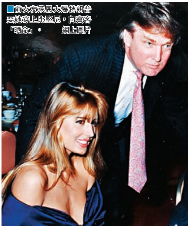
前女友萊恩大爆特朗普要她穿上比堅尼，向賓客「晒命」。