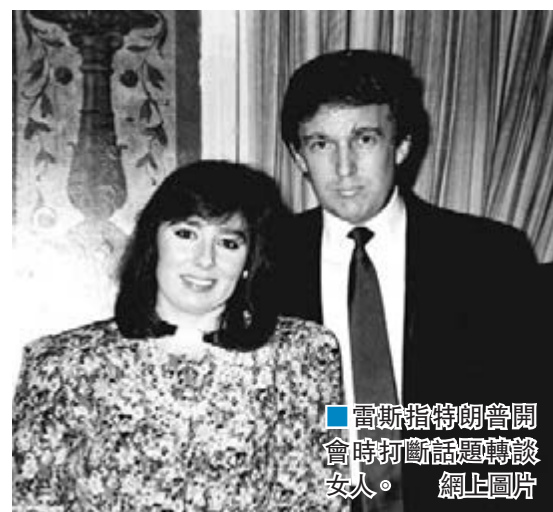
雷斯指特朗普開會時打斷話題轉談女人。