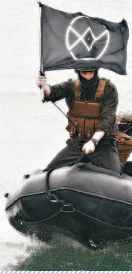
橡皮艇上的旗幟與「伊斯蘭國」相似。