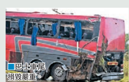
巴士車尾損毀嚴重。

得州近年發生多宗致命車禍，去年1月一架囚車失控衝出高速公路，撞中剛在公路下駛過的載貨火車，車內2名監獄職員及8名囚犯身亡。