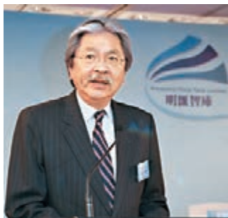
■曾俊華相信，香港有能力和經驗克服經濟周期挑戰。

香港文匯報訊（記者 尹妮）財政司司長曾俊華表示，本港今年首季經濟按年增長放緩至0.8%，較上一季低1.1個百分點，認為「雖然令人失望，但也非意料之外」。他認為，首季經濟情況反映環球經濟缺乏動力，先進經濟體需求疲弱，香港貨物出口亦受打擊，預料下半年環球經濟充滿風險。不過，他表示，近期本港經濟在出口及旅遊出現正面訊號，如香港貨物出口下跌7%，較韓國、新加坡等地13%至14%跌幅較小，在國際競爭中展現韌力。曾俊華相信，香港經濟基礎良好，有能力和經驗克服經濟周期挑戰。