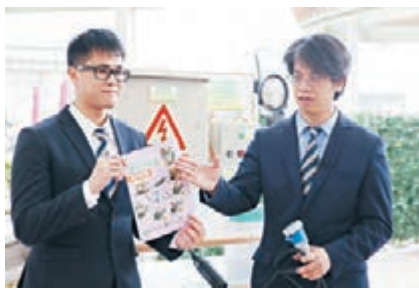
■工作人員介紹資助計劃。

本港基建工程進行得如火如荼，工友職業安全不容忽視。勞工及福利局局長張建宗表示，2011年至2015年5年間，建造業發生觸電工業意外共有53宗，當中14宗是死亡個案，情況令人關注。他續指，很多工業意外其實可以避免，因此勞工處連同職業安全健康局首推「中小型企業手提水氣掣資助計劃」，資助中小企購買合規格手提水氣掣，以免工人在電力工具漏電時受電擊傷害，預料補貼額高達80%。