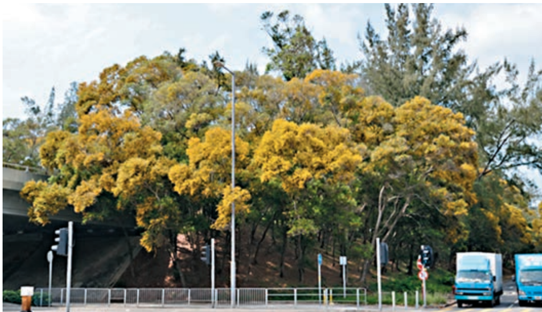
■每年春天過後，本港多處可見到「台灣相思」金黃花海。