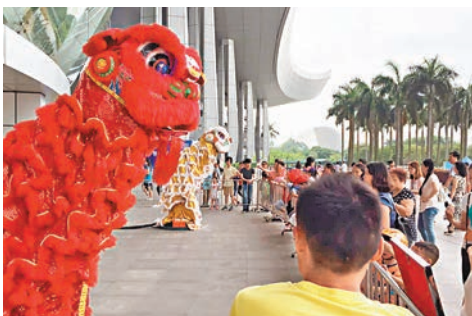
■ 舞獅機器人吸引許多觀眾。

香港文匯報訊（記者 帥誠 廣州報道）2016年廣州科技活動周暨兩岸四地科普系列活動昨日在廣東科學中心啟動，現場展出的無人機飛行表演、智能機器人、科學大講堂等吸引了不少民眾帶着孩子前來參觀。在兩岸四地科普聯展區，香港和台灣均展示了各自最新的納米技術研究成果。