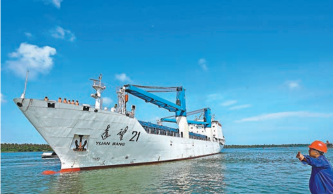
■ 「遠望21號」火箭運輸船將「長征七號」運載火箭安全運抵海南文昌清瀾港。

香港文匯報訊 昨日16時許，中國「長征七號」運載火箭安全抵達海南文昌清瀾港。該火箭將被分段運至發射場區，按計劃進行發射前各項測試準備工作，計劃在6月下旬擇機發射。