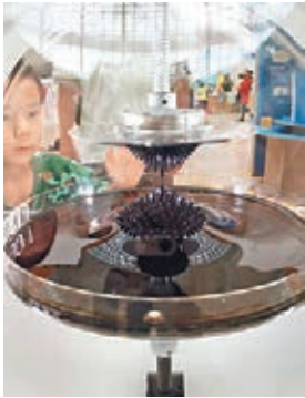
■ 港台納米技術展區。