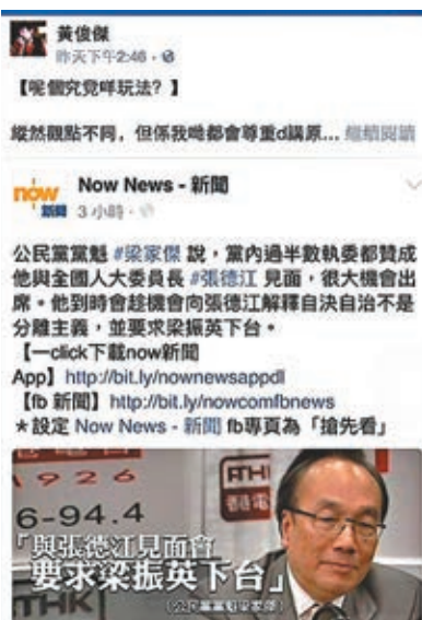
黃俊傑帖文《呢個究竟咩玩法?》。 網上截圖