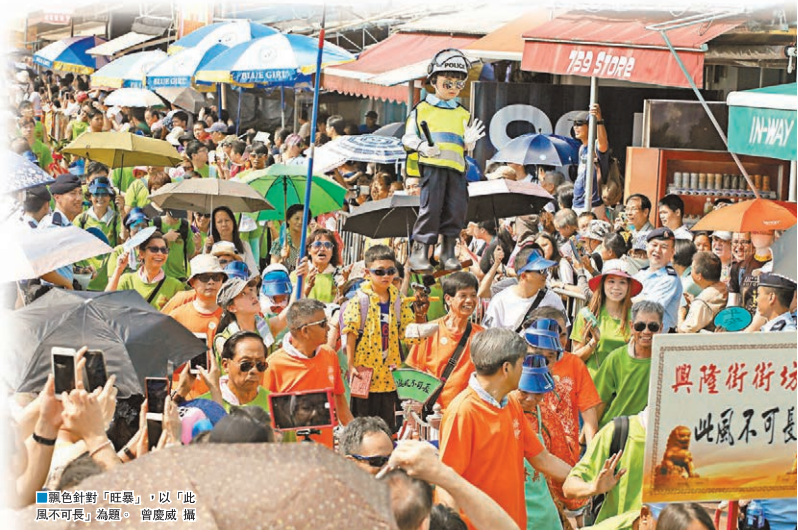
飄色針對「旺暴」,以「此風不可長」為題。