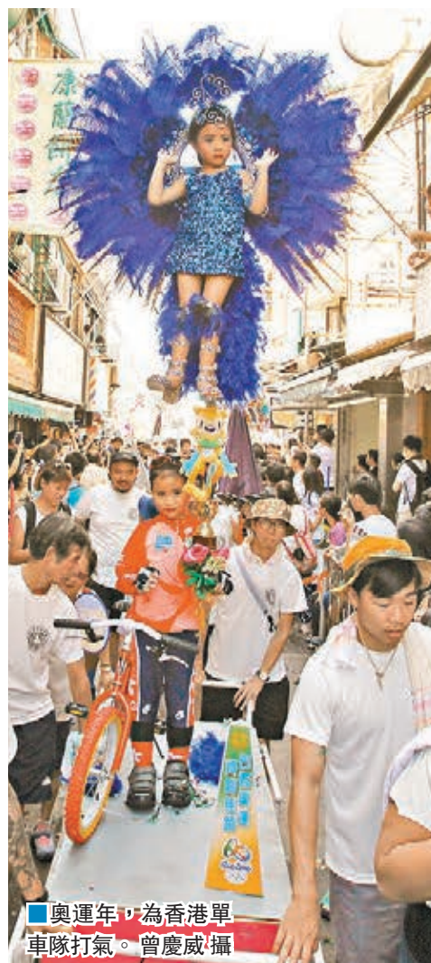
奧運年,為香港單車隊打氣。