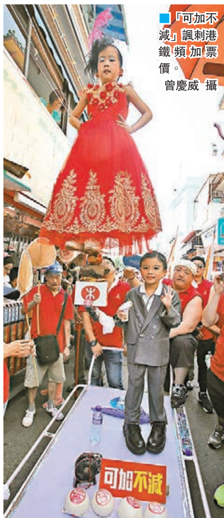
「可加不減」諷刺港鐵頻加票價。

另外,飄色繼續緊貼潮流,如大新街坊會以無線電視劇《張保仔》為藍本,並有多個「海盜」幫忙開路,沿途向市民大派金幣朱古力;長洲惠海陸同鄉會則模仿電視劇《公公出宮》女主角造型。而中國傳統故事「牛郎織女」、「哪吒」等亦是飄色的題材之一。