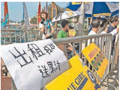
有商戶以80元至120元出租一座位,仍然有價有市。

扮演警察的黃小朋友年僅4歲,雖然他全程站在高處,又穿上全套警察服飾,但仍然處之泰然,一直面帶笑容,又不斷向遊人揮手,吸引市民拍照留念。雖然昨天天氣炎熱,但他表示「唔熱!都