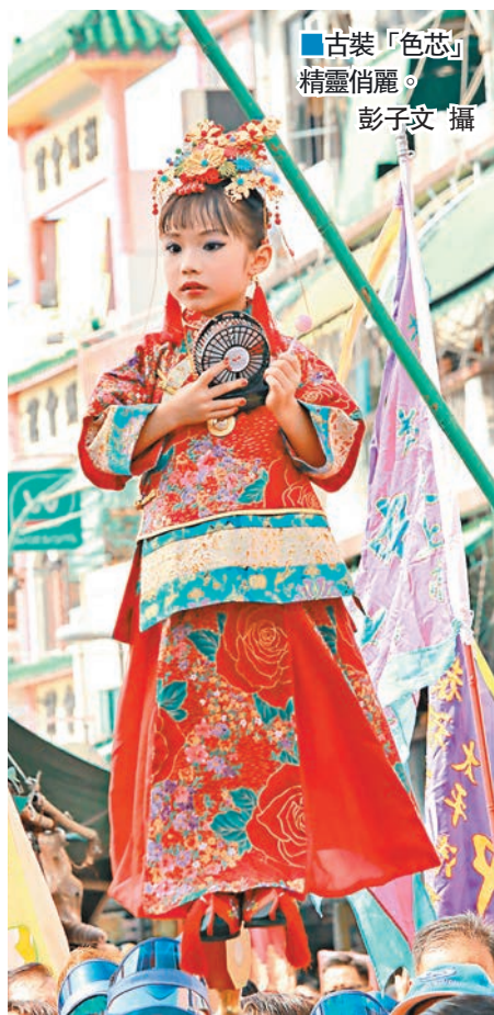
古裝「色芯」精靈俏麗。

居於屯門的陳先生與十多位朋友到長洲,他表示今年是第2次到長洲看飄色巡遊,認為現場很熱鬧,很有生氣。他又欣賞以旺角暴亂事件為題材,扮演警察的「色芯」,因為用了一個可愛的小孩來反映時事,他希望主題讓市民反思社會現況。 記者 翁麗娜