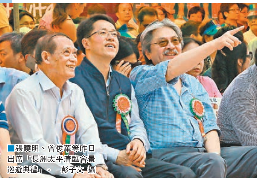
張曉明、曾俊華等昨日出席「長洲太平清醮會景巡遊典禮」。

香港文匯報訊(記者 鄭慧敏、翁麗娜)逾兩萬名市民及遊客昨日無懼高溫,到長洲欣賞太平清醮最矚目的飄色會景巡遊盛事。今年的飄色巡遊一如以往緊貼時事,如旺角暴亂、港鐵加價等;亦配合奧運年以本港運動員為題材。以旺角暴亂為題的飄色有兩名「色芯」分別扮演警察及年輕人,配以磚頭、警棍等道具。負責人表示,對事件並無立場,只希望社會和諧,不再發生同類事件。