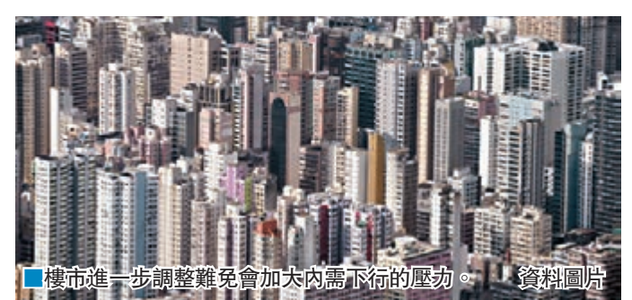
樓市進一步調整難免會加大內需下行的壓力。