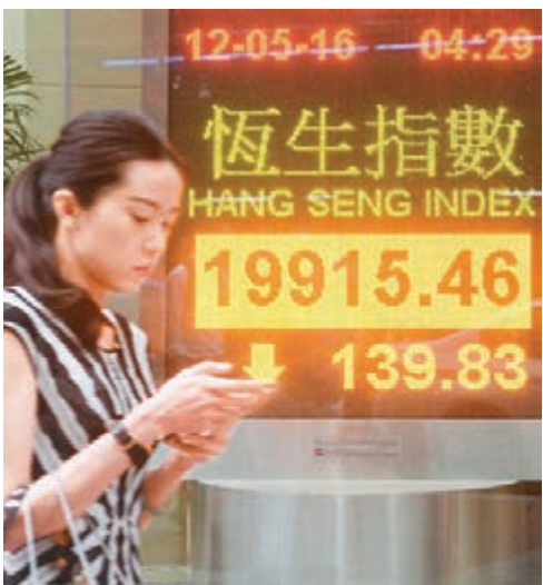
■ 港股昨終跌穿2萬點大關,是兩個月來的首次。恒指收挫139點,成交僅542億元。