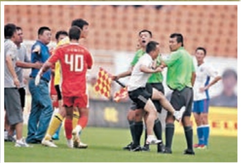
2010年中能球迷(白衫)衝入場內攻擊裁判。 資料圖片

當天上午，武漢市公安局在其官方微博@平安武漢上發文稱，警方已經成立工作專班，對事件展開深入調查，並將配合相關主管部門依法依規進行處理。武漢市公安局江漢分局在接受記者採訪時表示，分局現兵分兩路，一路一行5名民警前日上午趕赴南京的江蘇蘇寧俱樂部，進一步調查該隊球員遭受傷害的具體信息，以便根據傷情確定事件性質；另一路民警通過調看相關視頻資料，確定了部分在看台上涉嫌參與違法行為的人員，並着手對其身份進行核實調查。 ■新華社