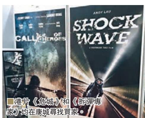
港片《危城》和《拆彈專家》均在康城尋找買家。

剛才提到，康城是相對地最星光熠熠的場合，來宣傳新片的俊男美女演員不在話下，也有不少品牌代言人亮相，星光悅目度不比奧斯