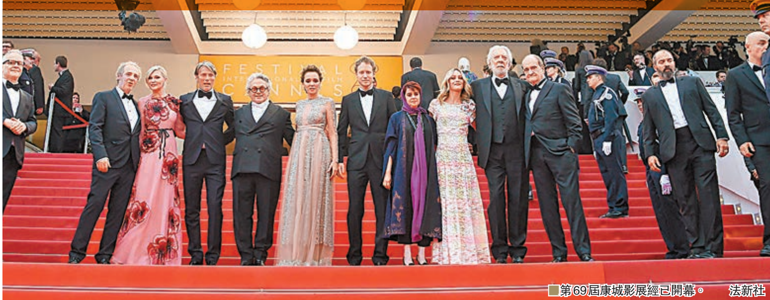
第69屆康城影展經已開幕。

一年不見又康城。對國際影壇有影響力的，又豈只奧斯卡或金球獎等頒獎禮，號稱「歐洲三大影展」的柏林影展、康城影展和威尼斯影展憑各自的江湖地位，每屆均吸引各地電影人踴躍參與；兩岸三地的業界當然沒有例外。只是，剛在法國開鑼的今屆康城盛會華語勢力大減，沒有香港、內地和台灣的作品角逐大獎，連評審也沒華人份兒，是有關方面不看重華語影圈，還是有其他原因使然？