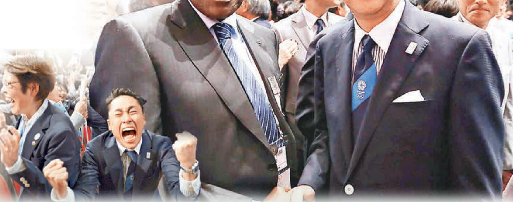
■前田聯主席迪亞克(左)曾與日本首相安倍晉三握手。