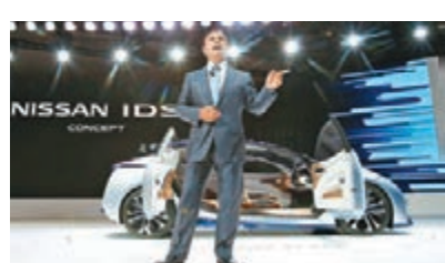
■日產宣佈以170億收購三菱汽車34%股份。

三菱汽車爆出造假醜聞後，4月汽車銷量急跌，公司市值蒸發40%，加上預料要支付巨額賠償費用，前景絕不樂觀。日本傳媒分析指，雖然目前三菱汽車大股東是持股20%的三菱集團，但2000年來集團已多次出資拯救三菱汽車，「長貧難顧」加上集團本身經營狀況惡化，因此三菱汽車不得