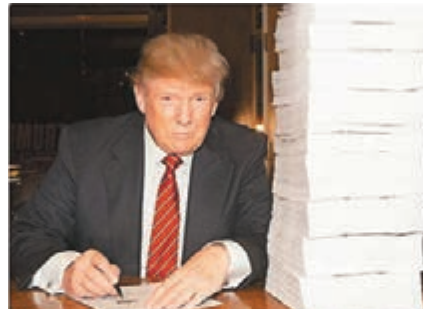
特朗普在社交網展示簽署報稅表的照片。