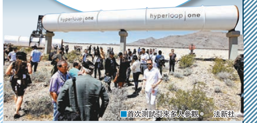
首次測試引來多人參觀。法新社

有份競逐超高速運輸工具「Hyperloop」概念工程的Hyperloop Technologies Inc(HTI)，前日於美國拉斯維加斯的試驗場首次測試，取得成功。公司表示，今次測試是磁浮列車技術發展的里程碑，如發展進度理想，預料最快2021年可進行載人測試。HTI的列車由車軌上的磁石發出磁力推動，列車與路軌之間產生懸浮效果，可在數秒內加速至時速643公里。今次測試中，列車以時速169公里速度行駛，並在路軌盡頭鋪設沙地作停車緩衝。HTI共同創辦人、前太空探索科技公司SpaceX工程師班布羅根稱，列車加速時，乘客感受與「飛機起飛相若」。不過專家指出，磁浮列車概念目前仍處於構思階段，將來可能面對成本高昂及監管等問題。 ■法新社/路透社