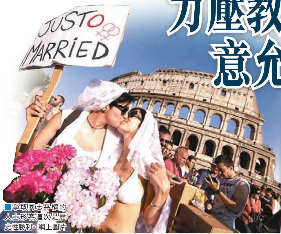
爭取同志平權的人士形容這次是歷史性勝利。