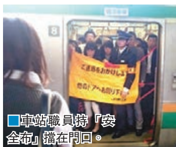
車站職員將「安全布」擋在門口。

地鐵或火車車門假如沒有關上，一般都不能開車，但日本JR橫須賀線前日早上便出現一幕罕見場面。一輛列車因為機件故障，導致第8節車廂一扇車門無法關閉，車站職員竟以一塊長1.2米、闊0.8米的「安全布」擋在門口，然後讓列車繼續行駛。