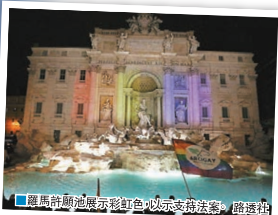
羅馬許願池展示彩虹色，以示支持法案。

西方國家近年陸續承認同性戀的法定地位，作為羅馬天主教會所在地的意大利，經歷長達數十年的爭論後，前日終於通過法案，容許同性伴侶「民事結合」，成為最後一個通過同類法案的西方主要國家。爭取同志平權的人士形容是歷史性勝利，但坦言法案仍有不足之處，會繼續爭取；反對法案的意大利天主教會秘書長則形容法案導致「全民皆輸」。